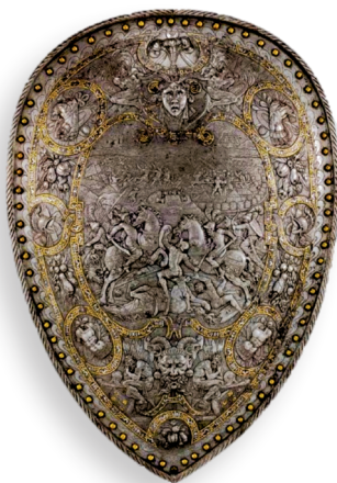
In copertina: Targa sbalzata e ageminata appartenuta a Enrico II, re di Francia, attribuita a Étienne Delaune, Jean Cousin il Vecchio e Baptiste Pellerin, Fontainebleau 1555 circa, New York, Metropolitan Museum of Art, inv. 34.85. Public domain.