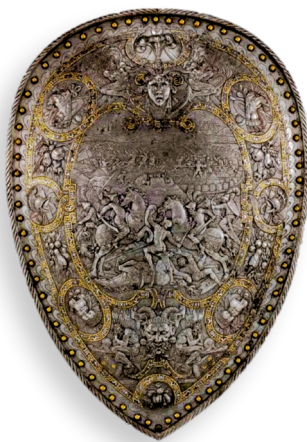
In copertina: Targa sbalzata e ageminata appartenuta a Enrico II, re di Francia, attribuita a Étienne Delaune, Jean Cousin il Vecchio e Baptiste Pellerin, Fontainebleau 1555 circa, New York, Metropolitan Museum of Art, inv. 34.85. Public domain.