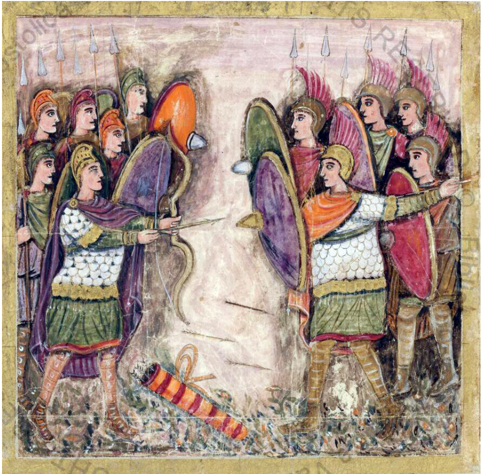
Vergilius Romanus (Cod. Vat. lat. 3867), Folio 188v