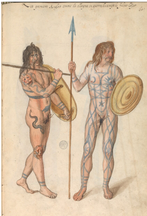
Gli avversari Britanni di Giulio Cesare immaginati da Lucas d'Heere, Théâtre de tous les peuples et nations de la terre avec leurs habits et ornemens divers, tant anciens que modernes, diligemment depeints au naturel , 1575, Ghent University Library, Foto Evadeco 2020, licensed in public domain (wikimedia commons).