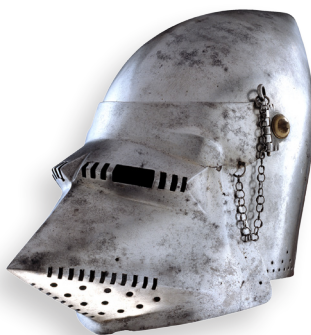
Bacinetto con visiera a becco di passero, Milano 1400-1430, Museo delle Armi "Luigi Marzoli" (inv. E 2)