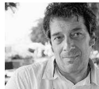
Scrittore. Sandro Veronesi