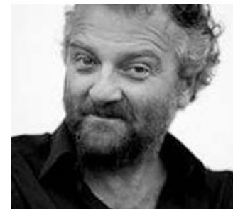
Regista. Giovanni Veronesi