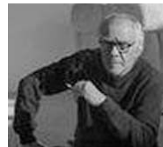
Artista visivo. Mimmo Paladino