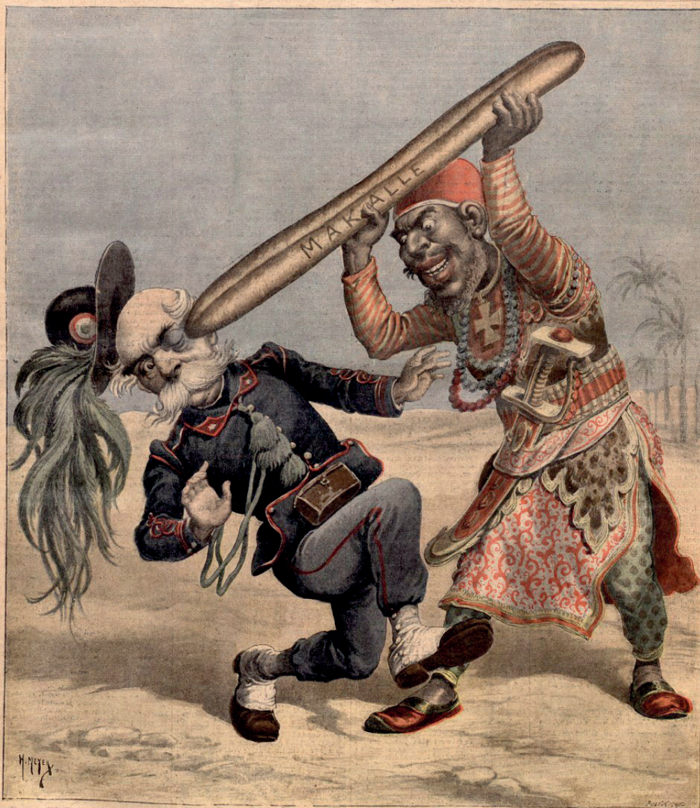
LE PAIN COMPLET