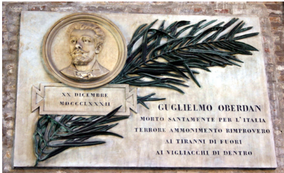
Bologna, Lapide a Guglielmo Oberdan. Cortile di Palazzo d'Accursio Foto Giovanni Dall'Orto, 9 Feb. 2008 (Wikimedia Commons)

a dispetto del fatto che il mondo transalpino ha giocato un ruolo fondamentale nelle vicende che hanno condotto alla nascita dell'Italia come nazione.