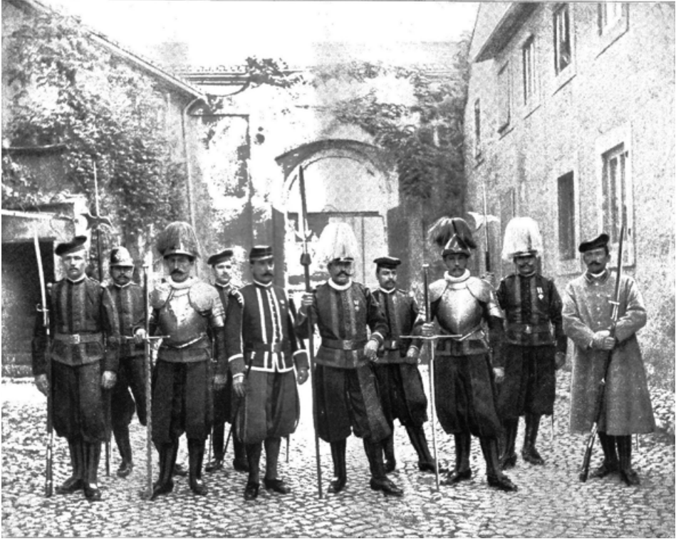
Fig. 1. Swiss Guards uniform

Security concerns multiplied after the dismissal and arrest of Benito Mussolini on 25 July 1943 and his replacement as head of government by Marshal Pietro Badoglio. Enraged by Mussolini's removal, Hitler spoke of dropping German paratroopers on Rome to seize the royal family, Badoglio, and others implicated in the change of government. Believing, incorrectly, that the Vatican had been a partner in the conspiracy against the fallen Fascist leader, Hitler ranted about sending his troops into Vatican City, but relented when reminded by Josef Goebbels, his propaganda chief, that an assault on the pope's tiny state would alienate Catholics around the world and give the Allies an important propaganda victory. 4