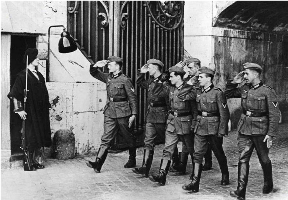
Fig. 3 German soldiers saluting the papal sentry

pursue information from parish priests or police authorities, the committee had to rely on personal recommendations, educational certificates, and the applicants' information forms, many of which, the committee suspected, were incomplete, misleading, or forged. 33