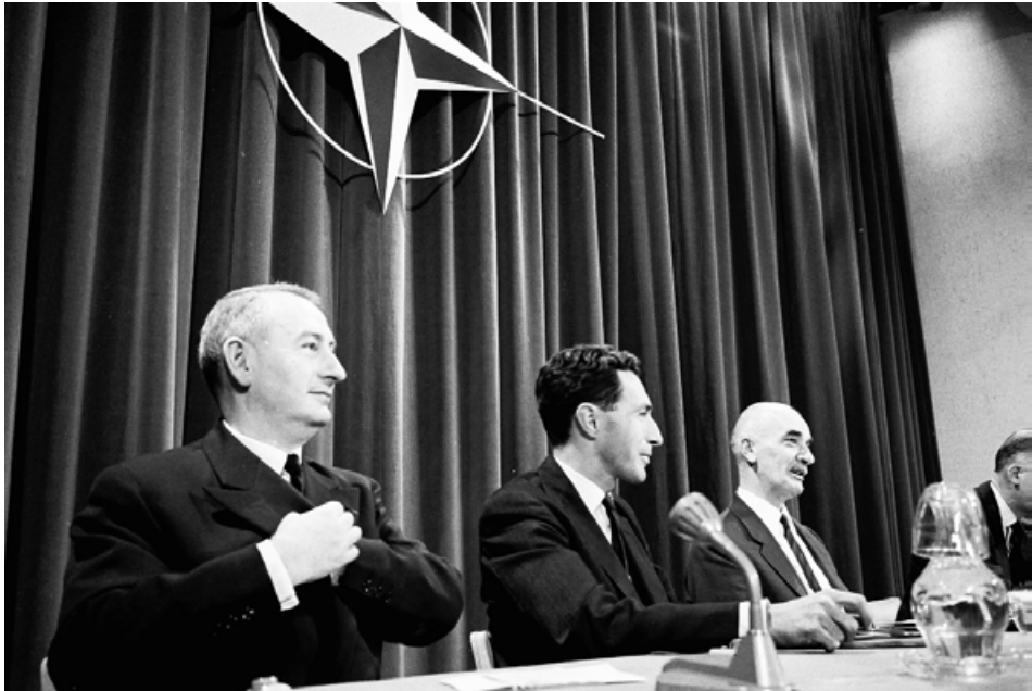
Georges Pâques (à gauche), à une Conférence de Presse avec le Vice-secrétaire général de l'OTAN Guido Colonna dei Principi di Paliano (1908-1983).

https://www.nato.int/cps/en/natohq/declassified_138448.htm