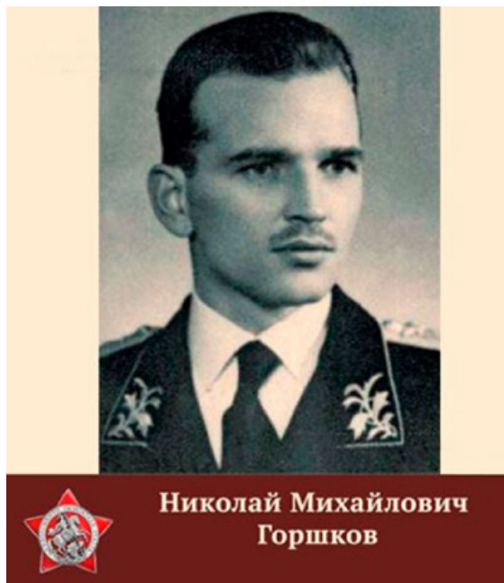
Nikolaj Michajlovič Gorškov (1912-1995)