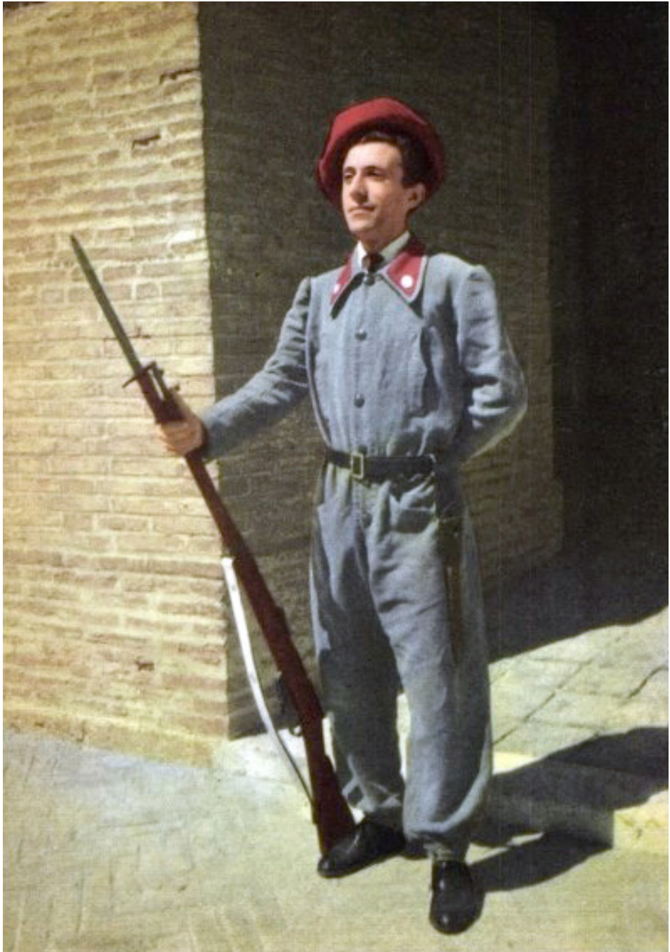
Fig. 4 Postcard Guardia Palatina d'onore di Sua Santità (Quora)