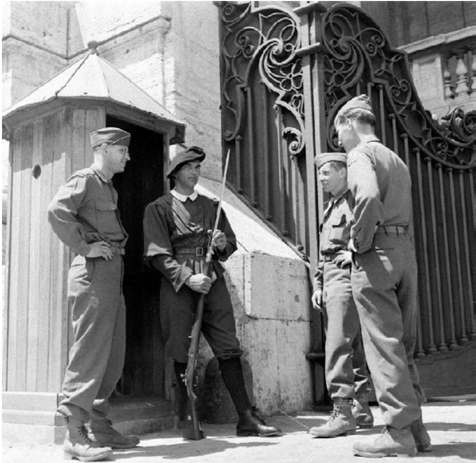
American Soldiers with a Swiss Guard

who were allowed to use their firearms if the number of uniformed intruders was small. There should be no armed resistance if the guardsmen were significantly outnumbered, if the chances of a successful defense were slight, or if such resistance would unduly endanger the lives of the civilians under Palatine protection. 51