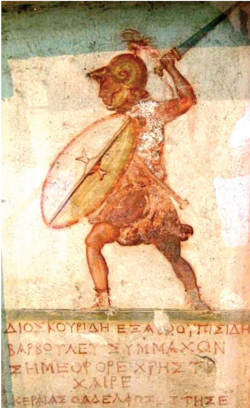
Stele di Dioskourides, II secolo a. C., che mostra un soldato con scudo thureos (thyreophoros) dell'esercito Tolemaico.