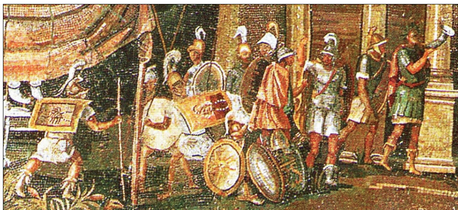
Soldati di Tolomeo, particolare dal mosaico Nilotico di Palestrina [public domain, GNU license, wikipedia].

Donald BLOXHAM, Genocide on Trial: War Crimes Trials and the Formation of Holocaust History and Memory , Oxford 2001; Peter NOVICK, The Holocaust and Collective Memory: The American Experience , London 2001; Jonathan HUENER, Auschwitz, Poland, and the Politics of Commemoration 1945–1979 , Athens-Ohio 2003; Ronit LENTIN (ed.), Re-Presenting the Shoah for the 21st Century , New York-Oxford 2004; Tzvetan TODOROV, Hope and Memory: Reflections on the Twentieth Century , London 2003; Mona S. WEISSMARK, Justice Matters: Legacies of the Holocaust and World War II , Oxford 2004; Joan B. WOLF, Harnessing the Holocaust: The Politics of Memory in France , Stanford, CA 2004; Michael ROTHBERG, Multidirectional Memory: Remembering the Holocaust in the Age of Decolonization , Palo Alto 2009.