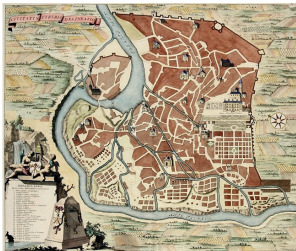
Fig. 3 - La mappa di Tivoli di David Stoopendaal, 1786. David Stoopendaal's map of Tivoli, 1786.