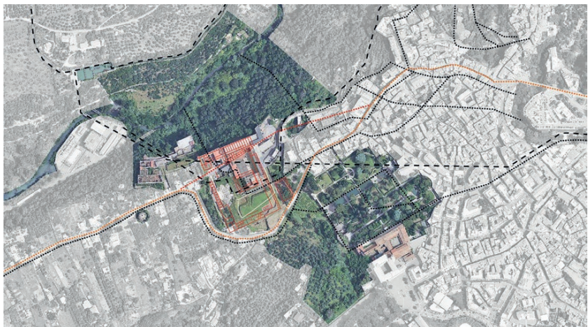
Fig. 4 - Sovrapposizione dell'area archeologica con il sistema paesaggistico di Villa d'Este/Santuario di Ercole Vincitore, il sistema dei canali e Via del Colle.

Superimposition of the archaeological area with the landscape system of Villa d'Este/Sanctuary of Hercules Victor, the canal system and Via del Colle.