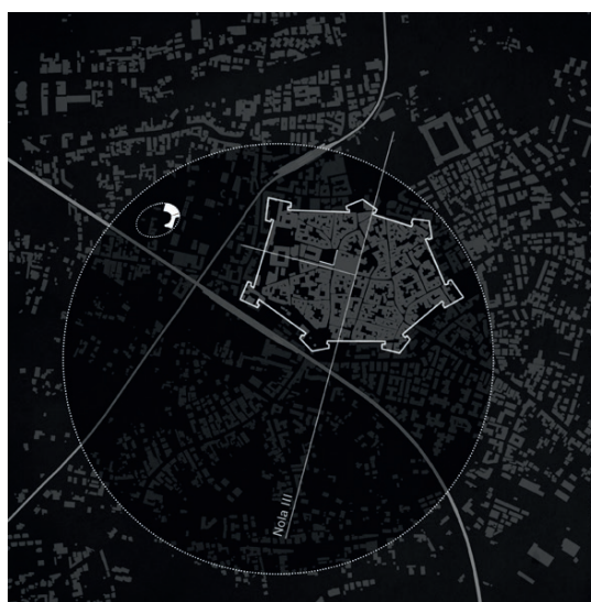
Fig. 6 - Relazioni tra le figure urbane: l’ipotetica cinta muraria circolare di Nola Vetus, le mura vicereali di fine Cinquecento, la persistenza delle giaciture del catasto “Nola III” nel tessuto urbano, l’anfiteatro laterizio e i nodi infrastrutturali della contemporaneità. (disegno di Mattia Cocozza).

The agrarian centuriations of the Imperial age in the Vesuvian territory. In evidence is the grid of the so-called “Nola III” cadastre, oriented at 15°E and with a net-measure of about 20 actus, (drawing by Mattia Cocozza).