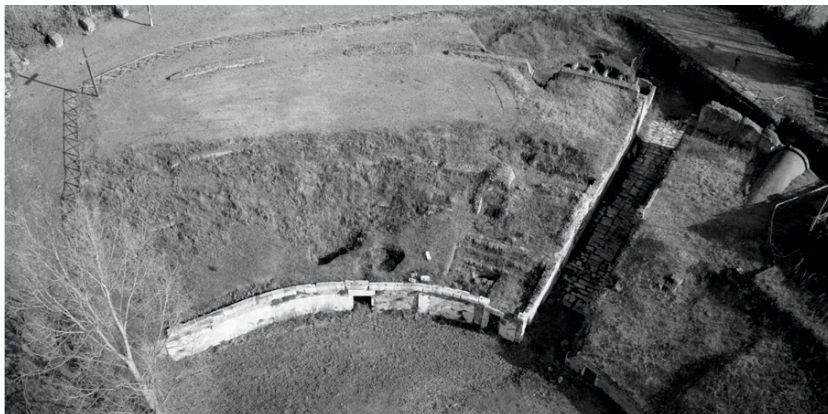
Fig. 2 - L'anfiteatro laterizio di Nola, 2018 (fotografia antecedente agli ultimi lavori di scavo compiuti dalla Soprintendenza Archeologia, Belle Arti e Paesaggio per l'Area Metropolitana di Napoli).

K.J. Beloch, Campanien, Breslau 1890. Beloch highlights in red the archaeological presences, locating on the plan the remains of the brick amphitheatre, the Temple of Augustus, and the marble theatre along the same diagonal axis identified by Ambrogio Leone in his engraving Nola Vetus.