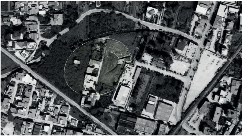
Fig. 3 - L'impronta dell'anfiteatro, in rapporto con l'andamento del terrapieno di Via Antica Muraglia, entro le aree "di margine" della città delimitate dall'intersezione dei due fasci infrastrutturali su ferro.

The footprint of the amphitheatre, in relation to the shape of the Via Antica Muraglia ground embankment, within the "edge" areas of the city delimited by the intersection of the two railway infrastructure bundles.