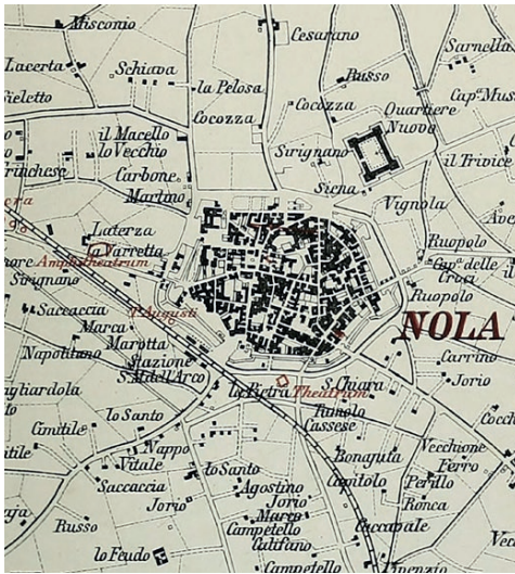
Fig. 1 - K.J. Beloch, Campanien, Breslau 1890. Il Beloch evidenzia in pianta, con il colore rosso, le presenze archeologiche, individuando i resti dell'anfiteatro laterizio, del Tempio di Augusto e del teatro marmoreo lungo il medesimo asse diagonale identificato da Ambrogio Leone nell'incisione Nola Vetus.

K.J. Beloch, Campanien, Breslau 1890. Beloch highlights in red the archaeological presences, locating on the plan the remains of the brick amphitheatre, the Temple of Augustus, and the marble theatre along the same diagonal axis identified by Ambrogio Leone in his engraving Nola Vetus.