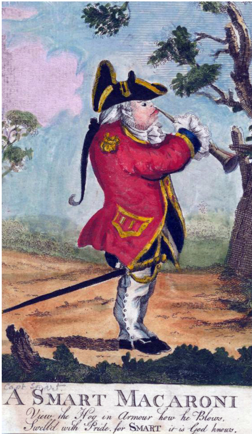
A Smart Macaroni, Caricature from "Martial Macaroni", in Anne S. K. Brown Military Collection. Courtesy by Brown University (see West, «The Darly Macaroni Prints and the Politics of "Private Man.»», Eighteenth-Century Life , 25.2 [2001], pp.170-1.