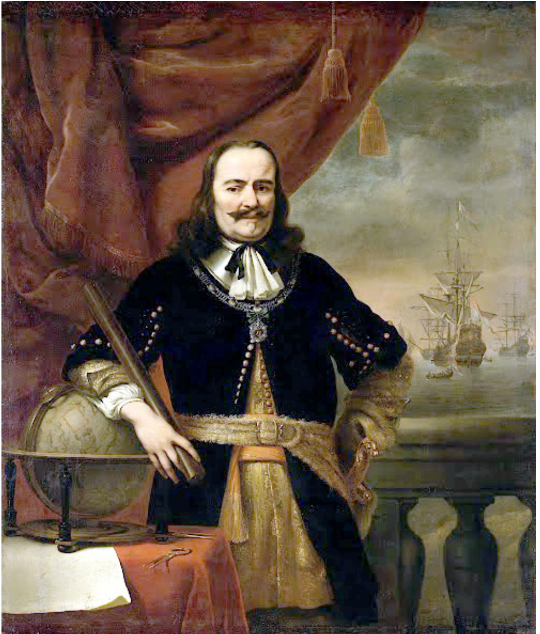
Fig. 1 Portrait (1667) de Michiel De Ruyter par Ferdinand Bols (Rijksmuseum, SK-A-44).