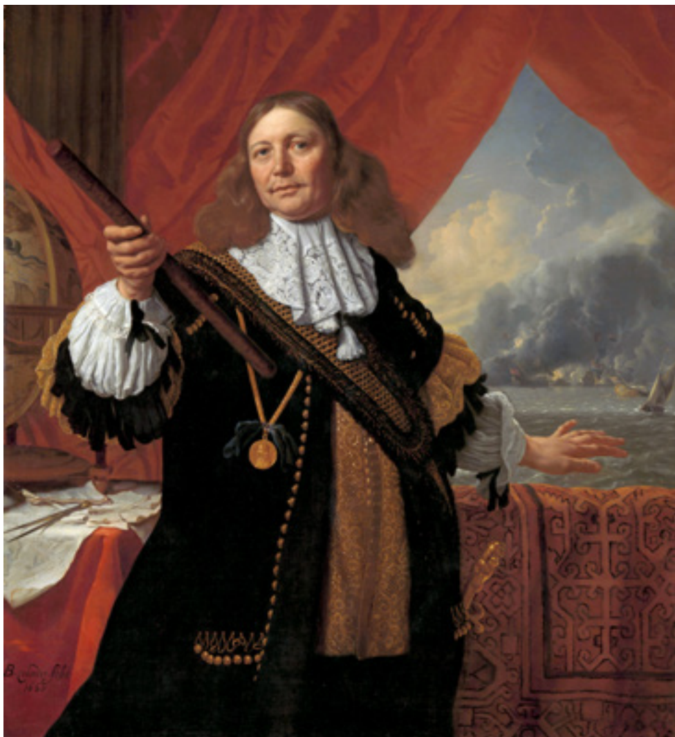
Fig. 8 Portrait (1669) du Vice-Amiral Johan de Liefde (ca. 1619-1673), par Bartholomeus van der Helst (Rijksmuseum, SK-A-832).

la réalisation d'un tombeau d'honneur et propose 10 000 florins. Le 4 février 1677 débute une procession qui sera saluée sur son passage, par tous les forts et les navires. L'arrivée à Amsterdam a lieu le 16 février. L'inhumation a lieu le 18 mars: les éperons, les gants, les armes, les armures, les casques, les signes de commandement sont apportés. Le corps est porté par ses pairs et suivi par les représentants de l'État, la famille, les proches, les ambassadeurs, les consuls