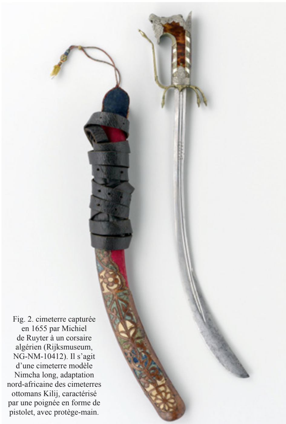
Fig. 2. cimenterre capturée en 1655 par Michiel de Ruyter à un corsaire algérien (Rijksmuseum, NG-NM-10412). Il s'agit d'une cimenterre modèle Nimcha long, adaptation nord-africaine des cimenterres ottomans Kilij, caractérisé par une poignée en forme de pistolet, avec protège-main.