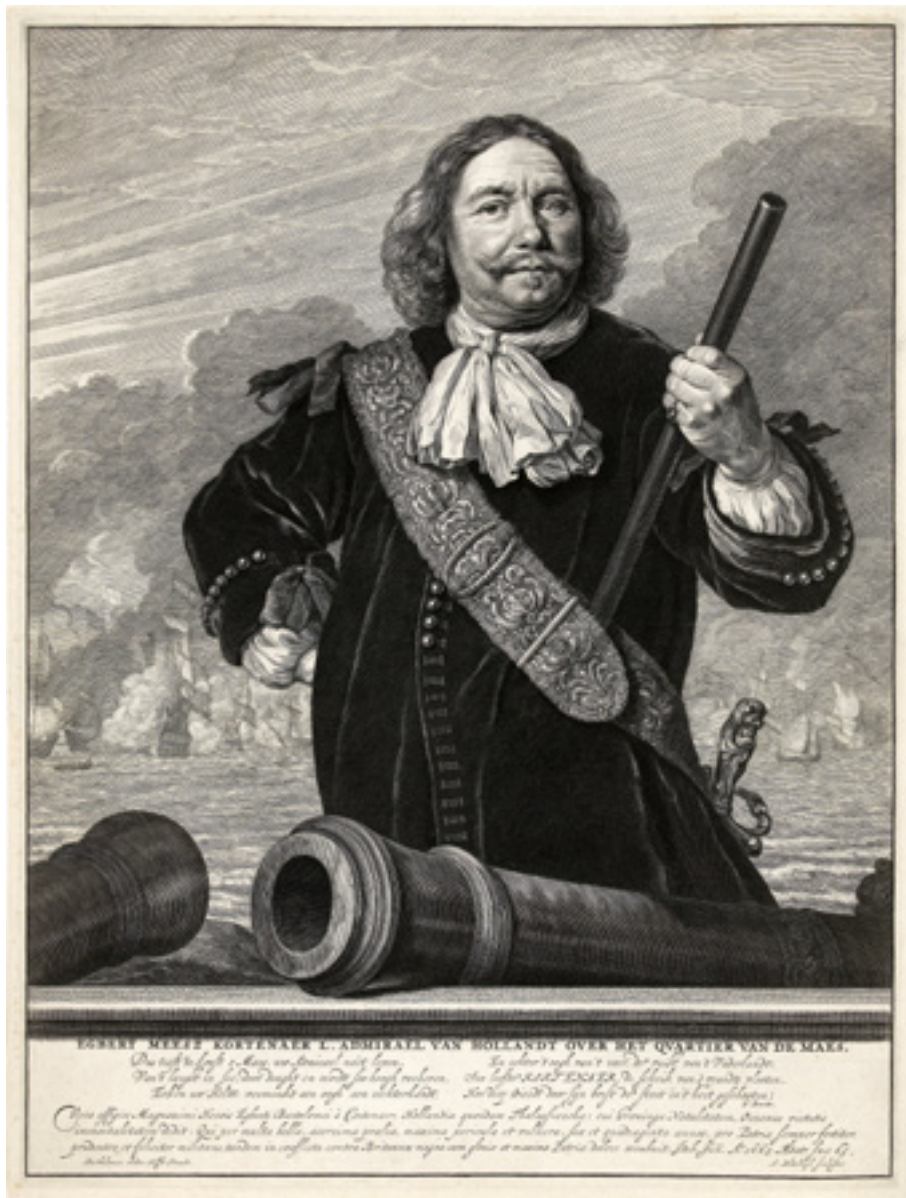
Fig. 5 Portrait de Egbert Meesz Kortenaer, L. Admiraal van Holland over het Quartier van de Maes (Rijksmuseum, RP-P-OB-67.479).

l'âge moyen à la nomination comme schout bij nacht tourne entre 41 et 43 ans. Il en est de même pour le conflit de 1688-1697. Cependant on remarque que lors du conflit qui suit celui-ci, l'âge moyen est de 47 ans. Et que lors de la période 1658-