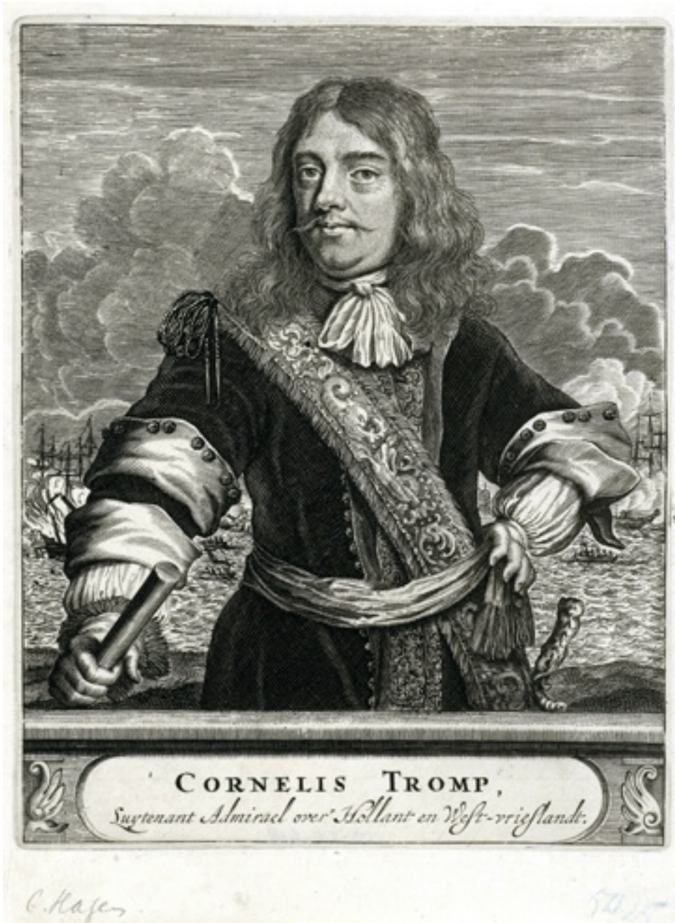
Fig. 3 Portrait (c. 1670) de Cornelis Maartenszoon Tromp, eau-fort gravé par Christiaan Hagen (c. 1635 - after 1687). (Rijksmuseum, RP-P-OB-55.618).