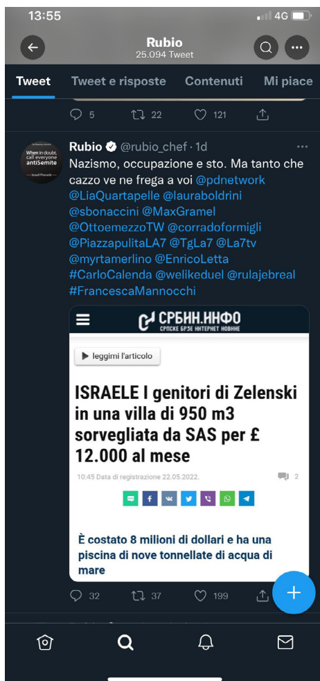
Figura 8. Tweet di Rubio del 23 maggio 2022.

Anche in questo caso Rubio rovescia in negativo "l'espressione dei suoi bisogni" e successivamente dei suoi sentimenti. Il suo bisogno di essere ascoltato, interpellato o