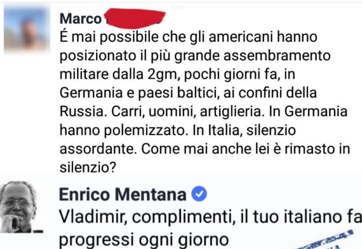
Figura 2. Tweet di BlastingMentana, 14 gennaio 2017.