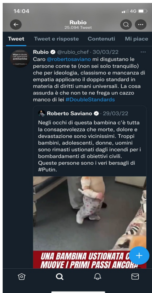
Figura 7. Tweet di Rubio del 30 marzo 2022.

In questa particolare situazione in cui cerca un confronto con Roberto Saviano (figura 7), osserviamo un esempio di tutto ciò che non fa parte di una "richiesta" nella comunicazione non violenta: anziché esprimere la volontà di un confronto con lo scrittore per quanto riguarda la coerenza delle sue affermazioni, Rubio lo aggredisce, delegittimando a priori un'eventuale risposta, dal momento che anziché focalizzarsi sulle sue richieste