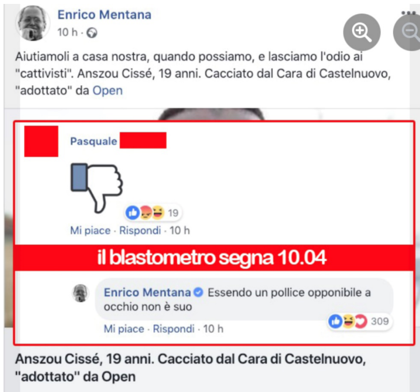
Figura 1. Post di Enrico Mentana su Facebook, 27 gennaio 2019.