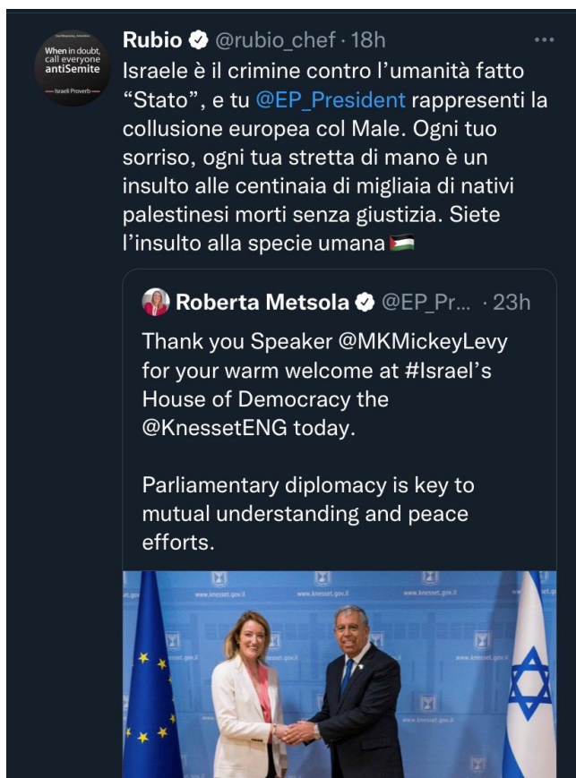
Figura 6. Tweet di Rubio del 25 maggio 2022, successivamente rimosso.

A fronte di quanto detto sin qui, si prenda come esempio il seguente tweet (figura 6), dove Rubini commenta l’incontro istituzionale avvenuto fra la presidentessa del Parlamento Europeo Roberta Metsola e Mickey Levy, Speaker della Knesset. Il sentimento