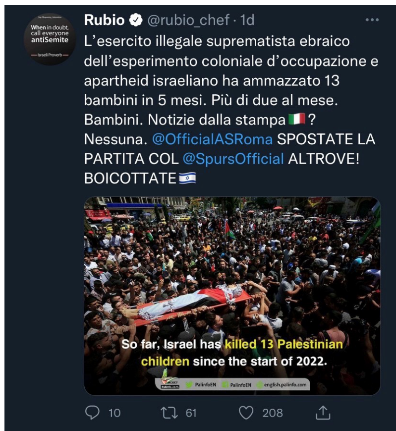
Figura 5. Tweet di Rubio del 28 maggio 2022.

In questo modo, qualsiasi interlocutore che intenda contraddire questi argomenti si troverà a dover discutere ribattendo con modi altrettanto violenti che, nella maggior parte dei casi, tendono a concentrarsi più sulla terminologia utilizzata anziché sull'evento, alimentando discorsi vuoti dal punto di vista dell'ascolto e della volontà di comprendere l'altro. Una possibile finestra d'apertura di un dibattito non violento secondo le categorie di Rosenberg potrebbe suonare così: "Dall'inizio del 2022, sono morti 13 bambini palestinesi colpiti da ferite d'arma da fuoco da parte dei soldati dell'esercito israeliano. Per rispetto di queste vittime innocenti auspico un serio dibattito che coinvolga anche la