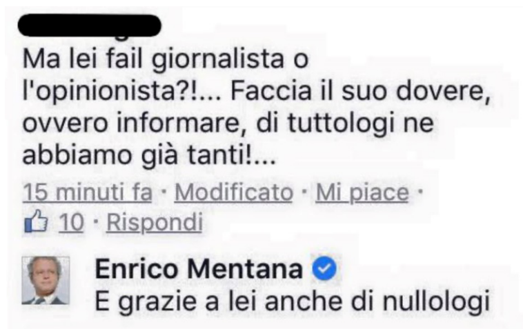
Figura 3. Post tratto dalla pagina Facebook "Enrico Mentana Che Imbruttisce La Gente" del 29 agosto 2016.