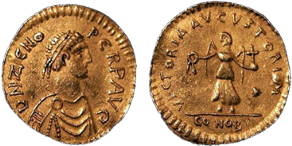
Fig. 1. Tremissis di Zenone. Zecca di Costantinopoli, Secondo Regno (476-491 DC).

ture dei rapporti tra i due leaders Illo e Zenone, infatti, sono difficili da cogliere a causa della frammentarietà delle fonti a nostra disposizione, ma questi si fecero sempre più articolati e complessi, finché non si arrivò a un tentativo di rivolta da parte del primo, che rappresentò, verosimilmente, il momento più critico della stagione di potere degli Isauri a Costantinopoli. L'ambivalente atteggiamento reciproco dei due warlords isaurici, infatti, sarebbe una cartina di tornasole delle profonde lacerazioni interne alla compagine isaurica. Tutta la storia del regno di Zenone, del resto, è indissolubilmente legata ai rapporti che il sovrano ebbe con Illo. Questi, infatti, finì per attirare a sé tutte quelle “forze centrifughe” di opposizione al legittimo imperatore, che resero la basileia zenoniana uno dei momenti più instabili della storia dell'Impero tardoromano 9 . Già nei frustoli a noi pervenuti della riflessione dello storico Candido Isaurico, che si è ipotizzato fosse membro dell' entourage dello stesso Illo 10 , emerge chiaramente come il potere e l'autorità di Zenone si fondassero sul consenso degli Isauri, e dunque sull'intesa con Illo 11 . Sembra, quindi, evidente come Zenone, durante il suo regno, non abbia