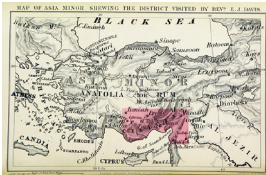
Fig. 3 John Edwin Davis, Life in Asiatic Turkey: A Journal of Travel in Cilicia (Pedia and Trachæa), Isauria, and Parts of Lycaonia and Cappadocia, Map and illustrations, from original drawings by the author and Mr. Ancketill , London, Edward Stanford, 1879, p. 30.

Longino di Selinunte 36 e Longino di Cardala 37 . Nel frattempo, a Costantinopoli si presero misure tempestive contro la fazione isaurica. In primis fu immediatamente soppressa la donazione annuale di cui questi godevano fin dal tempo della rivolta di Illo 38 e che gravava sulle casse dello stato: la cifra ammontava a 1400 libbre d'oro stando a Candido Isauro 39 e Giovanni Antiocheno 40 , o a 5000 libbre d'argento secondo Evagrio 41 , e sulla quale gli storici antichi avevano espresso