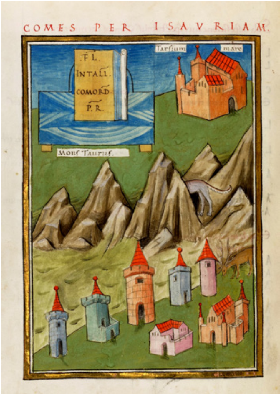
Fig. 2 Bodleian Library, MS. Canon. Misc. 378 Notitia Dignitatum , fol. 114v, Comes et praeses Isauriae .