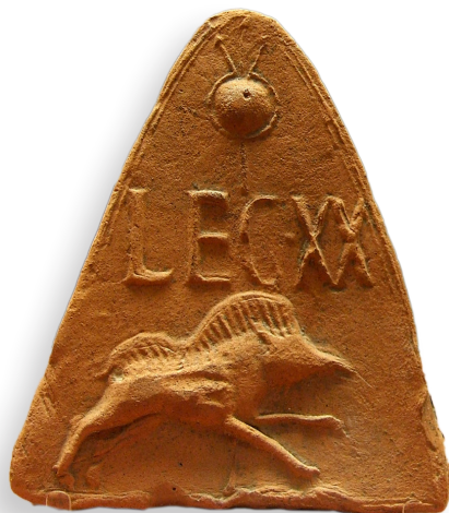
Antefissa in maiolica del II/III secolo d.C. col nome della Legione XX Valeria Victrix e un cinghiale, simbolo legionario, proveniente da Holt, Clwyd, Galles. British Museum, Londra. Numero di registrazione PE 1911,0206.1.