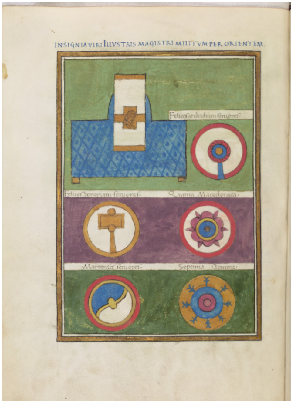
Fig. 4 Bodleian Notitia Dignitatum , fol. 92v, Insignia viri Illustris Magistri Militum per Orientem.