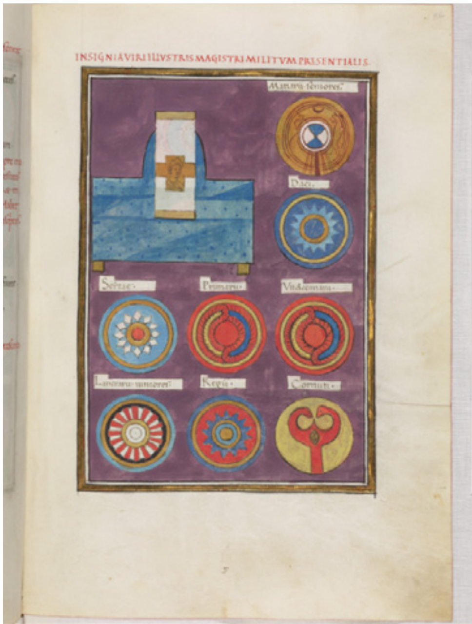
Fig. 6 Bodleian Notitia Dignitatum , fol 96r, Insignia viri Illustris Magistri Militum Praesentalis II.