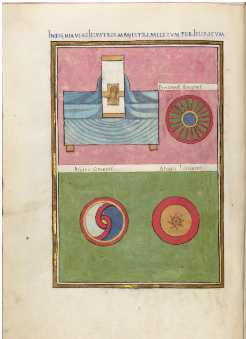
Fig. 7 Bodleian Notitia Dignitatum , fol. 99v, Insignia viri Illustris Magistri Militum per Illyricum.