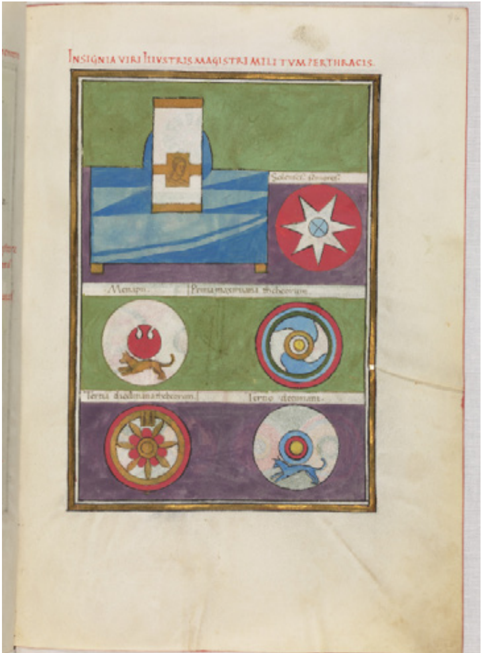
Fig. 5 Bodleian Notitia Dignitatum , fol. 94r, Insignia viri Illustris Magistri Militum per Thraciam