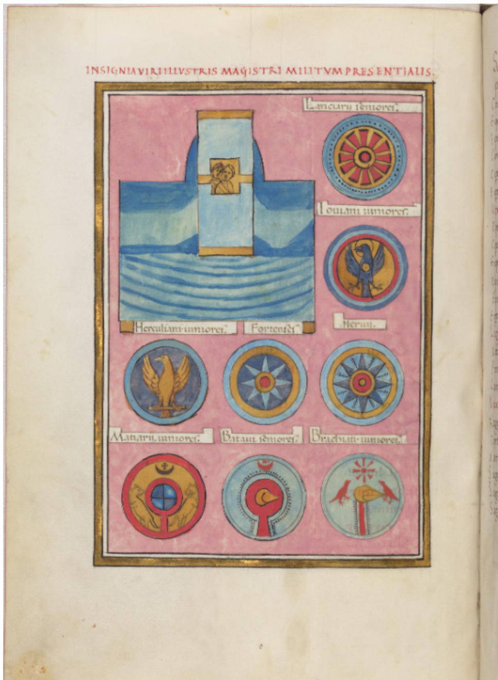
Fig. 3 Bodleian Libraries, Oxford University, Ms Canon. Misc 378, Notitia Dignitatum , CC-BY-NC 4.0. Fol. 91v, Insignia viri Illustris Magistri Militum Praesentalis I