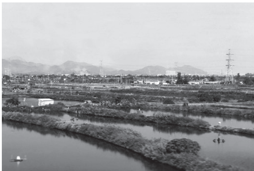
Fig. 4 - Il sistema integrato dei "dyke ponds". The integrated dyke ponds system.

beginning of the Ming dynasty until the Republican era, land reclamation and embankment construction activities continued to intensify as the population increased, altering the delicate balance of the delta and increasing the frequency of floods (Weng, 2007, p. 1052). With the founding of the People's Republic of China, the design of hydraulic works assumed a prominent role in the activities of the national government (Ball, 2016, pp. 219-220): in the Zhujiang River delta, the new approach resulted in the construction of regionally scaled, interconnected ring levees (Tai, 2018, p. 125).