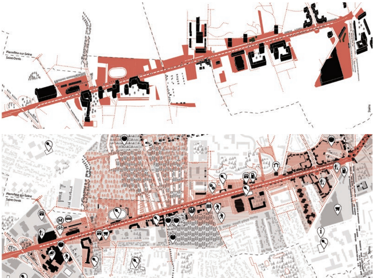
Fig. 5 - A. Brès, C. Hanappe, M.-A. Jambu, B. Mariolle, C. Mazzoni, D. Petrescu, C. Petcu e gli studenti del master e del dottorato del laboratorio UMR AUSser: carta della trasformazione della qualità delle strade regionali, realizzata nell'ambito del progetto intitolato Vision du territoire de la Seine Saint Denis à l'horizon 2030, 2020. © Bres/Mariolle-UMR 3329 AUSser.

A. Brès, C. Hanappe, M.-A. Jambu, B. Mariolle, C. Mazzoni, D. Petrescu, C. Petcu and the PhD students and researchers of the UMR AUSser, Intensifying the metropolitan area, Vision for the territory of Seine Saint Denis at the 2030 horizon, 2020. © Bres/Mariolle-UMR 3329 AUSser.