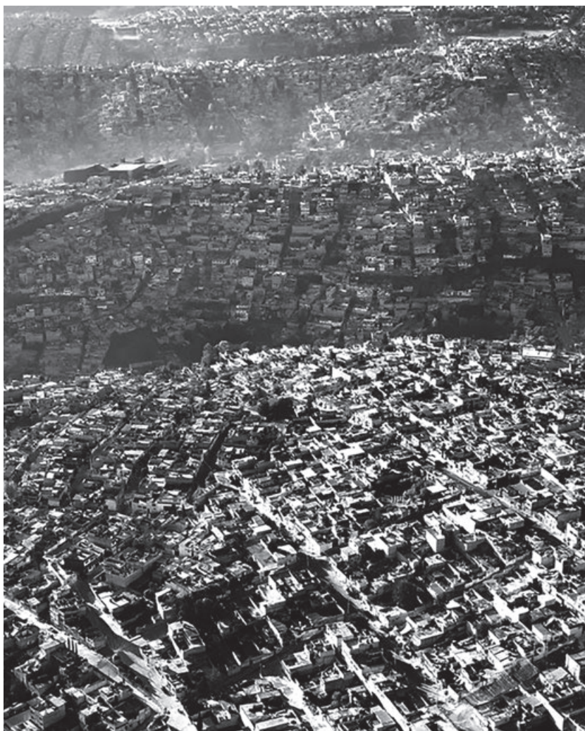
Fig. 2 - Nuove espansioni urbane a Città del Messico.

An indispensable collaboration, which broke down in the space of a few years, starting from the end of the Second World War when, in the Italy of the race for profit, no rule or political will managed to contain frenzied deforestation, the silting of waterways, a whirlwind and ubiquitous building expansion, the lack of care for the hydrographic system. Not even the lesson of the first major environmental disaster