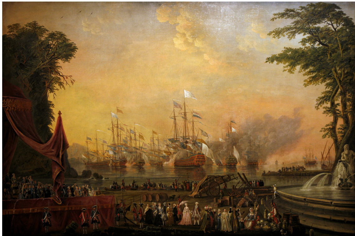
Image n°3 : Flotte de SAINT-JOSEPH, Manœuvre navale à Toulon, juillet 1777 , huile sur toile, 1777, Musée national de la Marine (Wikipédia Commons).

seau, à des exercices de canon et de mortier, à un simulacre de combat naval 22 .