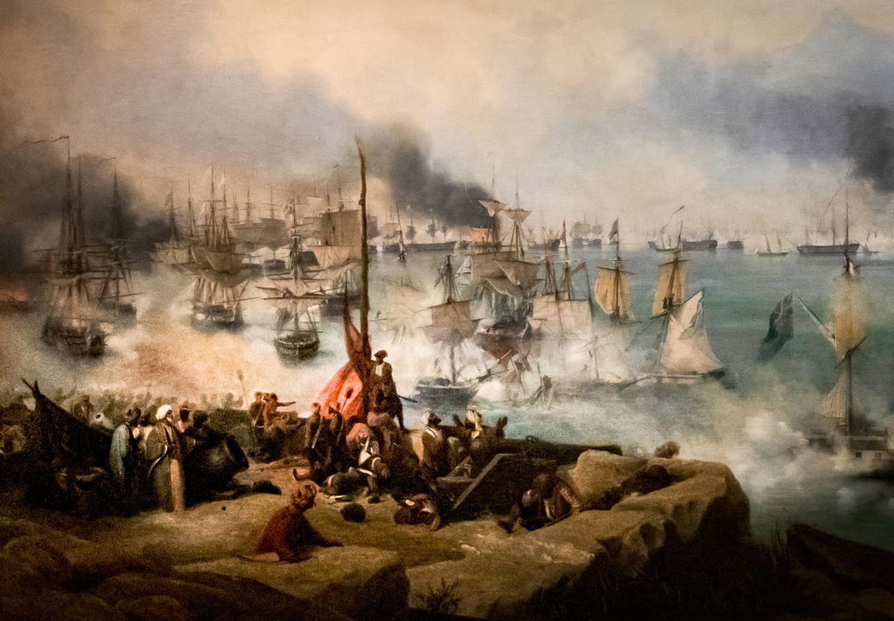
Image n°4 : Louis GARNERAY, La bataille de Navarin , huile sur toile, 1830, Musée d'art et d'histoire de Narbonne (Wikipédia Commons).

En plus des souvenirs de la grandeur militaire française présents dans de nombreux esprits, de cette envie parfois brûlante de retrouver et de vivre de tels moments, et malgré la mise à distance de l'idée militaire, la mer et le naval parviennent, durant la Restauration, à se faufiler et à attirer l'attention de la société française des années 1820.