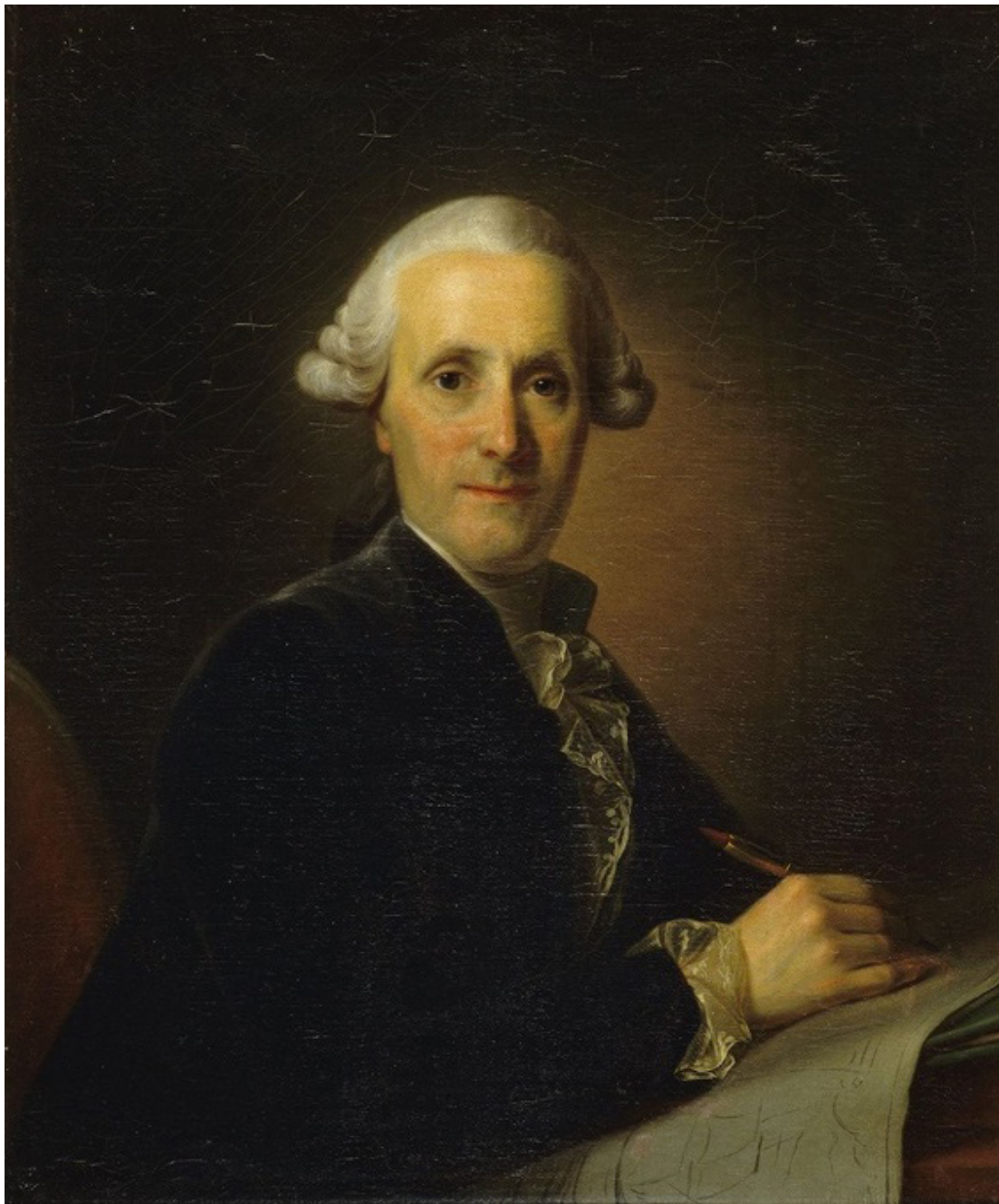
Image n°2 : Nicolas-Marie OZANNE, Portrait de Nicolas Ozanne , huile sur toile, 2 e moitié du XVIII e siècle, Musée national de la Marine (Wikipédia Commons).