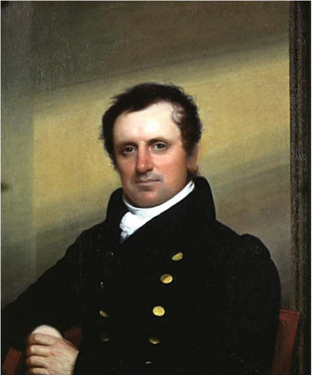
Image n°6 : John JARVIS, Portrait de James Fenimore Cooper, 1822, New York State Historical Association.