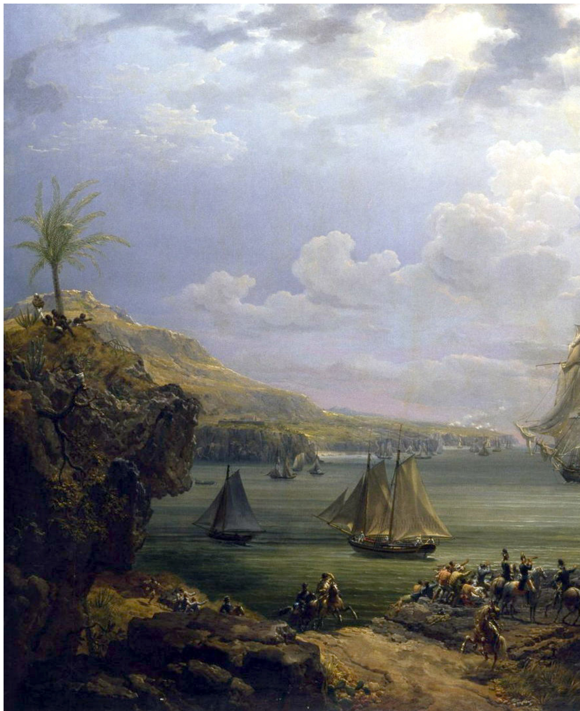
Image n°5 : Louis-Philippe CRÉPIN, Combat de la Poursuivante contre l'Hercule , 1803, huile sur toile, 1819, Musée national de la Marine.