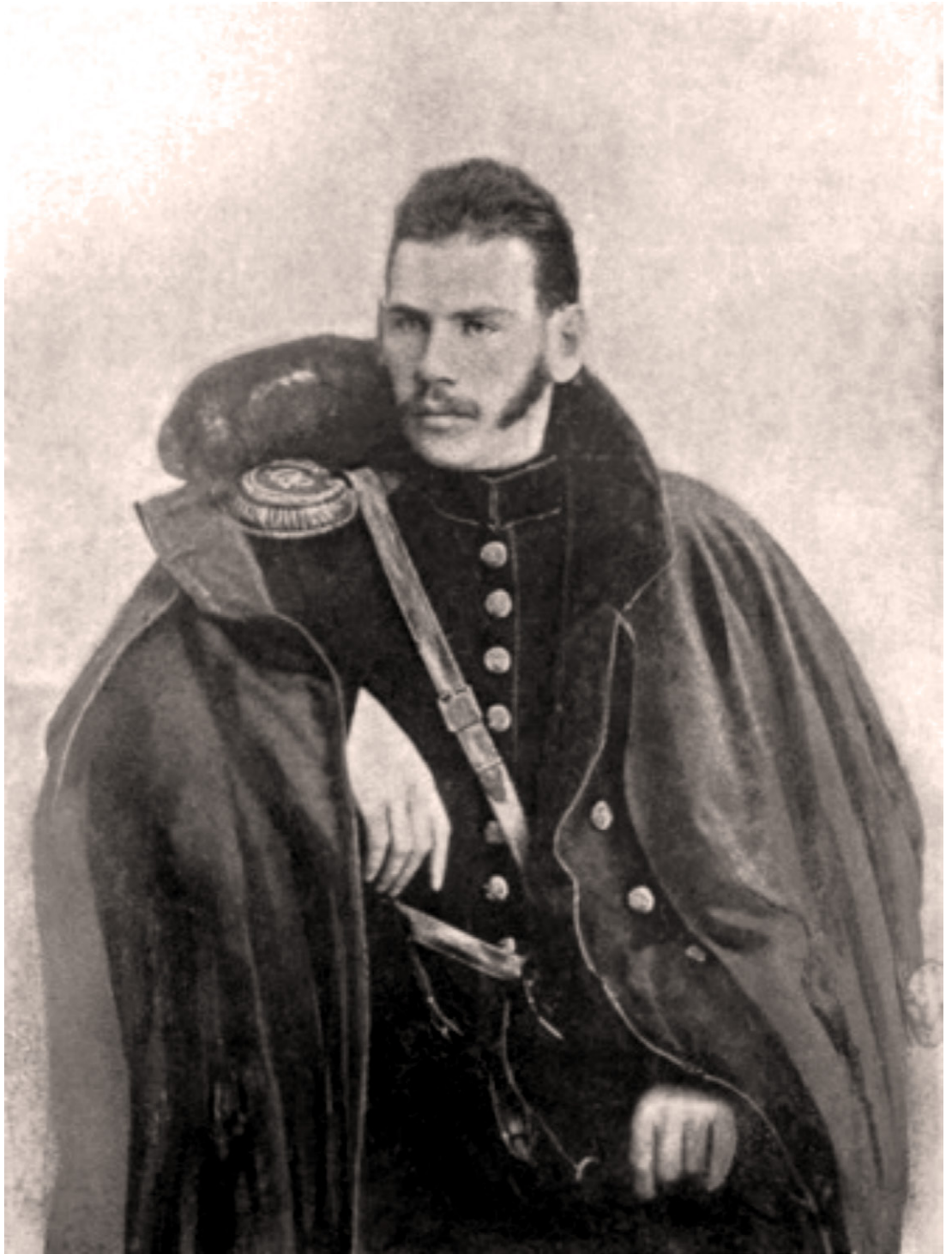
Lev Nikolaevič Tolstoj in uniforme di capitano d'artiglieria