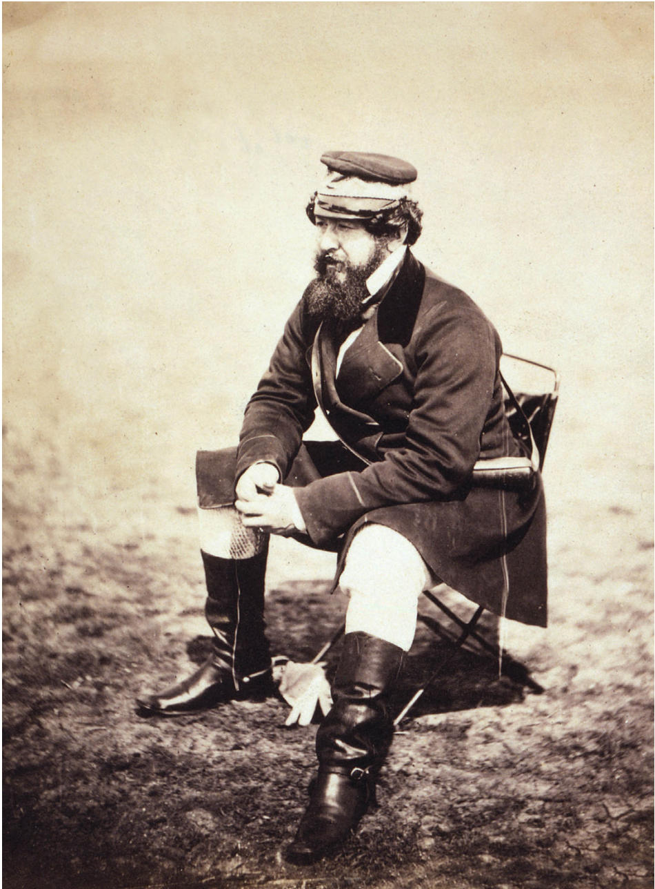
Roger Fenton (1819-1869), ritratto di William Howard Russell (1827-1907), corrispondente di guerra del Times in Crimea (1855).