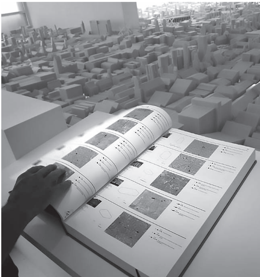
Fig. 1 - L'allestimento mette in scena il rilievo dei luoghi dell'abbandono, che risultano spaesati, in quanto privi del relativo territorio. Il Dutch Atlas of Vacancy, in primo piano, è la "figura" che descrive, attraverso la logica impersonale dell'elenco, l'accumulazione paratattica dei modelli del patrimonio edilizio dismesso, posti sullo "sfondo".

The exhibition sets the scene for the relief of places of abandonment, which are displaced, as they lack the corresponding territory. The Dutch Atlas of Vacancy, in the foreground, is the "figure" describing, through the impersonal logic of the list, the paratactic accumulation of models of the disused building stock, placed in the "background".