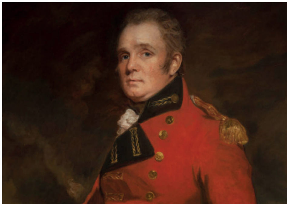
Thomas Maitland, en un cuadro de John Hoppner, de principios del siglo XIX

cualquier dato sobre los posibles contactos que el famoso libertador de Argentina, Chile y Perú, José de San Martín, pudiera tener en Europa. «Mi pretensión era encontrar alguna aguja en aquel pajar. Para ello recorría los manuscritos en busca de referencias a Sudamérica, en particular al Río de la Plata», contaba en su libro Maitland & San Martín (Universidad Nacional de Quilmes, 1998).