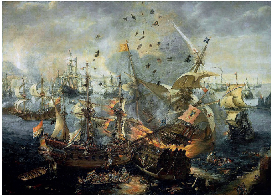
Battle of Gibraltar of 25 April 1607 by Cornelis van Wieringen - Rijksmuseum Amsterdam. (Source: Wikimedia Commons)- Painting included by Jubelin as an example of naval engagement.

Jubelin, Alexandre, Par le fer et par le feu. Combattre dans l'Atlantique XVIe-XVIIe siècles , Paris, Passés Composés, ministère des Armées 2022, 276 p.