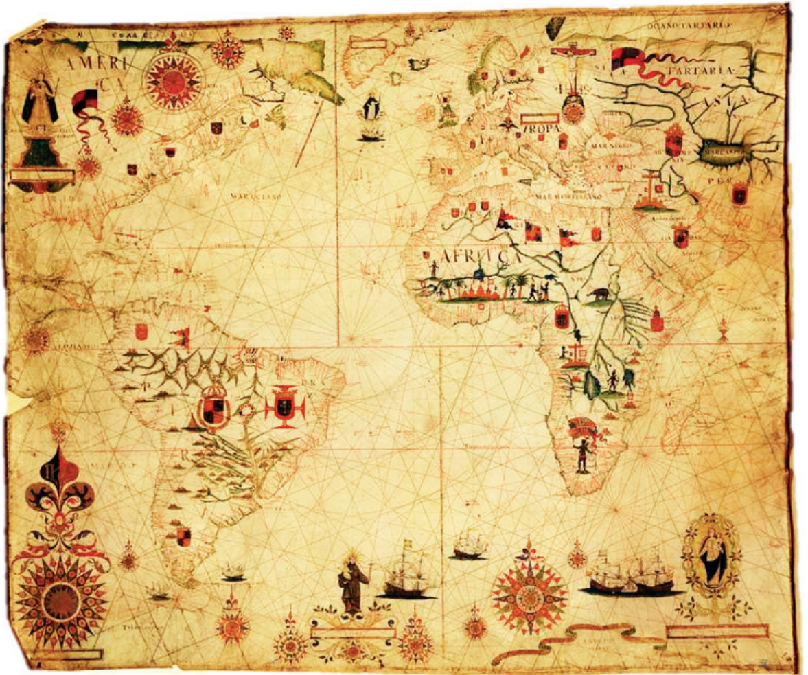
Portolano dell 'Oceano Atlántico