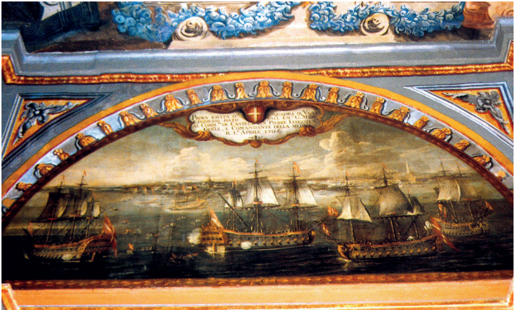
1° aprile 1705: prima uscita in mare della nuova Squadra dei Vascelli (crediti e luogo dell'affresco: Anton Quintano; lunette del Palazzo Presidenziale, La Valletta, Malta)

potete riescirne difficilissima l'intrapresa ai nemici senza la necessaria assistenza di un'armata di mare».