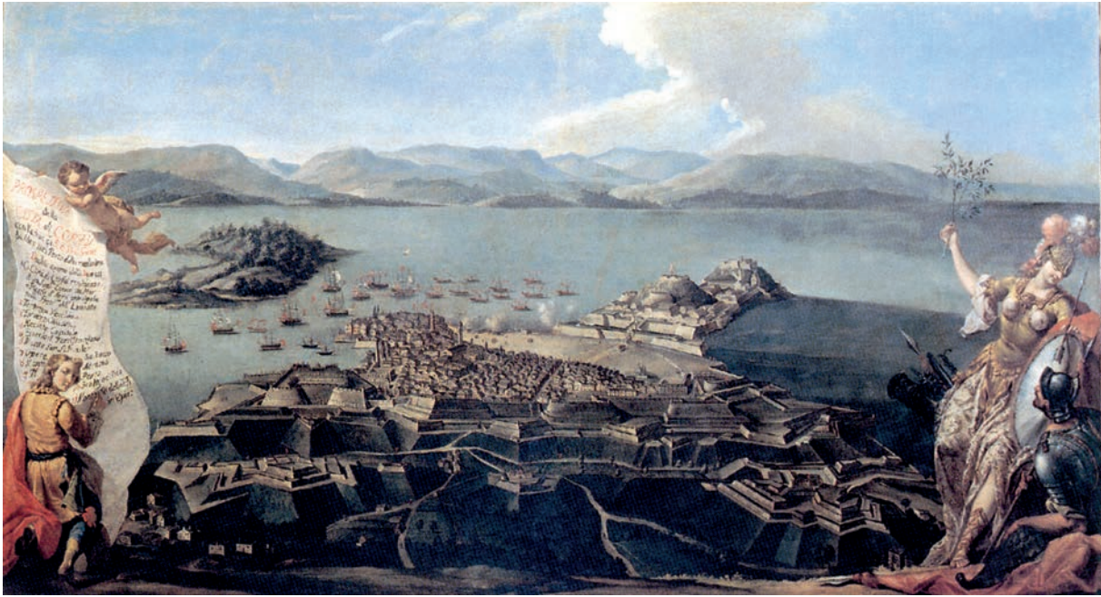
Veduta della città e del canale di Corfù con le navi della flotta veneziana alla fonda

comunque fuori dal controllo della Serenissima; temevano inoltre che le migliori condizioni degli equipaggi ausiliari, ben pagati e con una migliore qualità della vita a bordo, minassero la disciplina dei marinai veneti, sui quali gravava il maggior peso degli scontri. Da parte loro, i capitani ausiliari ritenevano di poter disporre di ampi margini di manovra all'interno della flotta congiunta, cosa poco gradita ai veneziani 39 .