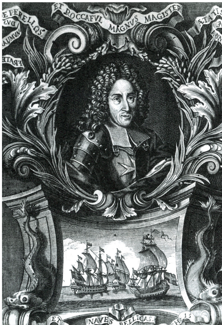
Ritratto del gran maestro Raimondo Perellos y Roccaful (crediti e luogo del ritratto: Anton Quintano, Statuti del 1631, Borgonovo 1719; National Library of Malta, La Valletta, Malta)