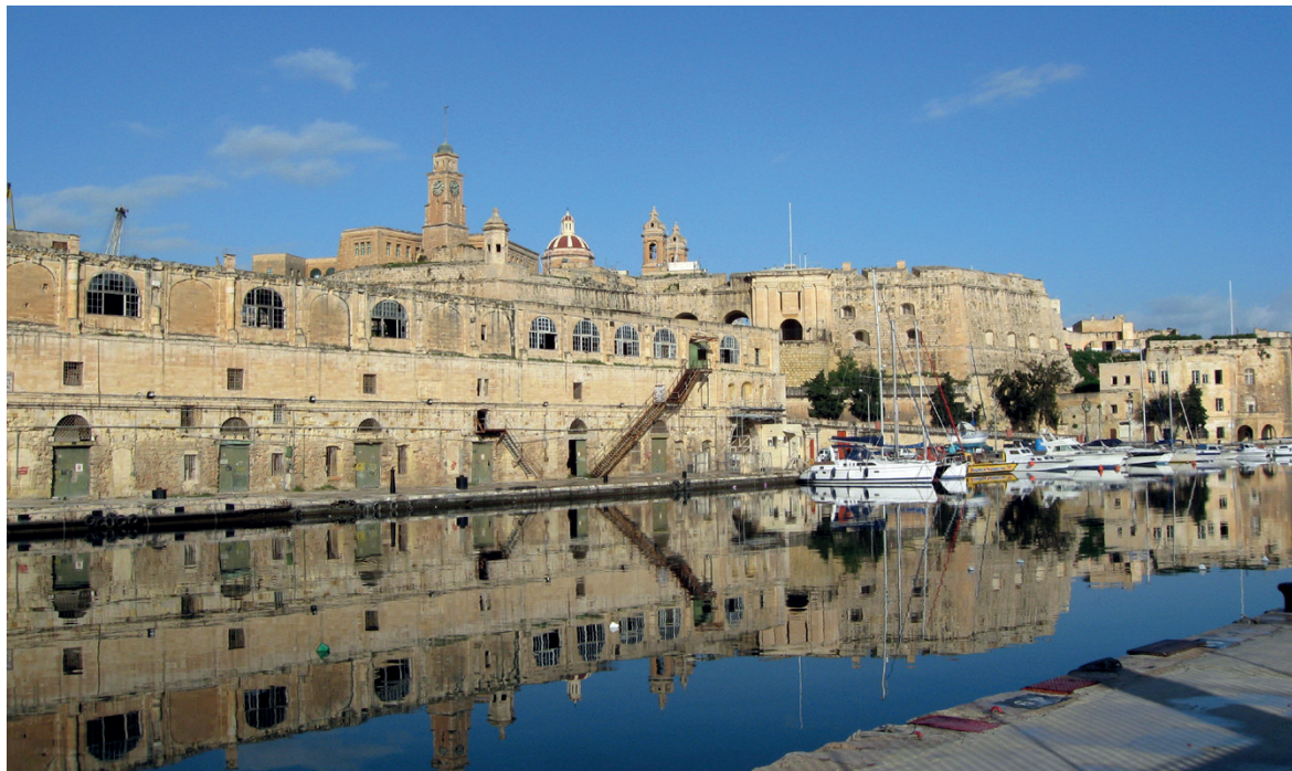
Veduta generale dei magazzini presso l'arsenale di Bormla, a Malta, dove venivano ormeggiati i vascelli della squadra dell'Ordine;

Come si può ricavare dalle pagine di Petrucci, i vascelli maltesi furono gli ultimi ad abbandonare la campagna: le galee toscane erano già partite il 7 settembre, seguite il 25 da quelle maltesi, mentre i pontifici ritardarono la partenza fino al 5 ottobre. L'autore non lesinò, inoltre, qualche commento personale sulla condotta della guerra da parte dei veneziani, asserendo che non ci fosse alcuna «politica 31 che possa metterli al coperto d'una più che patente negligenza, et in conseguenza renderli illesi dalla taccia che potranno meritam.(en)te dargli gl'huomini di guerra, sì dentro come fuori dalla christianità».