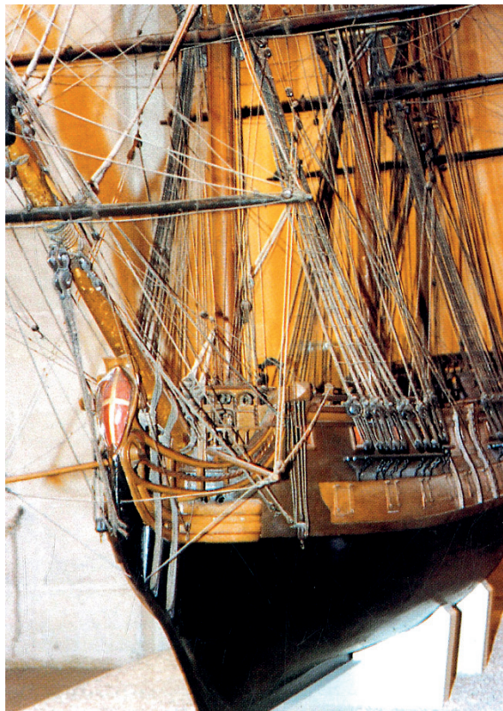
Modello in scala del vascello di terzo rango San Giacomo (crediti e luogo: Anton Quintano; Malta Maritime Museum, Birgu, Malta);

La campagna di Levante del 1716 presenta la particolarità di essere stata condotta sia dai vascelli dell'Ordine, sia da una squadra formata ad hoc da mercantili genovesi «armati in guerra» 32 e posti al comando di ufficiali maltesi. Grazie al paziente lavoro di Paolo Giacomo Piana, le navi della squadra pontificia-genovese sono state recentemente identificate come segue: