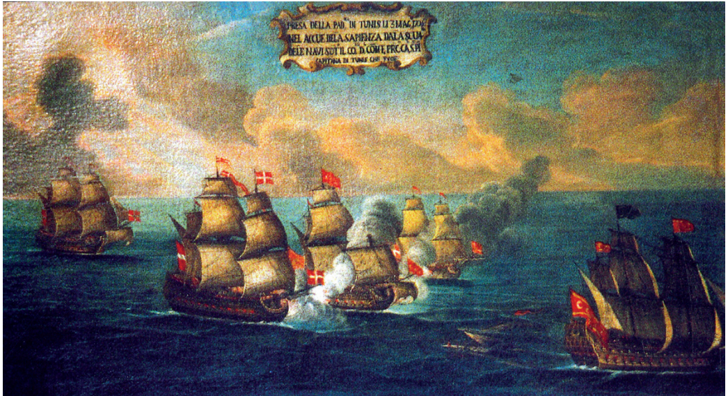
3 maggio 1706: presa del vascello La Rosa , ammiraglia della flotta di Tunisi, nelle acque fra le isole di Strofhades e Sapienza, a sud del Peloponneso; olio su tela del XVIII secolo, scuola maltese (crediti e luogo: Aldo Antonicelli per Heritage Malta; Malta Maritime Museum, Birgu, Malta)

che i veneziani, ora sotto la guida del più energico capitano generale Andrea Pisani, continuavano a condurre la guerra in maniera fiacca e approssimativa: l'assedio di Corfù terminò soprattutto grazie ad una violenta tempesta che distrusse completamente le trincee ottomane, costringendo la flotta a reimbarcare le truppe; le navi veneziane avrebbero potuto approfittarne per attaccare e infliggere una sonora sconfitta al nemico, ma «...i signori veneziani parvero più inclinati a farli il ponte d'oro, et ad allargarli il passaggio, più tosto che attraversarli il ritiro».