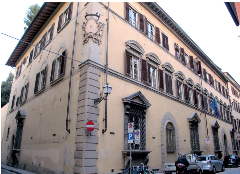
Palazzo Vivarelli-Colonna oggi, dove sono ospitati alcuni assessorati del comune di Firenze, fra i quali quelli dedicati al turismo, alla cultura e ai musei (fonte e luogo: Wikimedia Commons; via Ghibellina 30, Firenze)

anche quella dell'Ordine di Malta venne organizzata intorno all'impiego della galea, che ne rimase la principale imbarcazione militare almeno fino alla fine del Seicento. Fu nei primissimi anni del XVIII secolo che i vertici dell'Ordine, sotto la guida dal gran maestro Raimondo Perellos y Roccaful, cavaliere di comprovata esperienza militare e con una spiccata sensibilità all'ammodernamento della marina maltese, decisero la costituzione di una nuova squadra interamente composta da vascelli che avrebbe affiancato le galee, anche se le due squadre si trovarono ad operare congiuntamente assai di rado. L'impiego di navi a vela da parte della