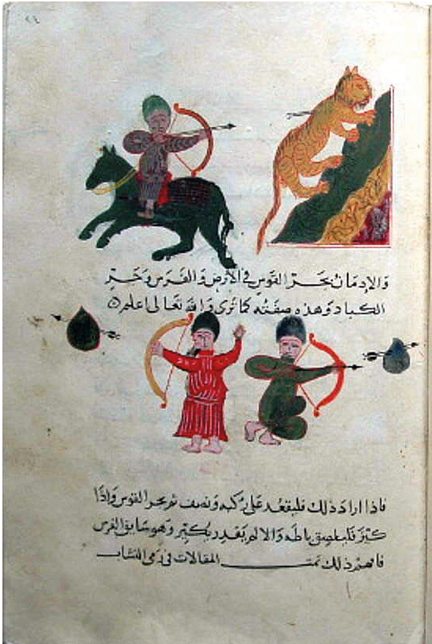
Addestramento al tiro con l'arco ad Abdurrahman b. Kitab al-makhzun jami` al-funun di Ahmad al-Tabari, Istanbul, Biblioteca del Palazzo Topkapi, MS Revan 1933