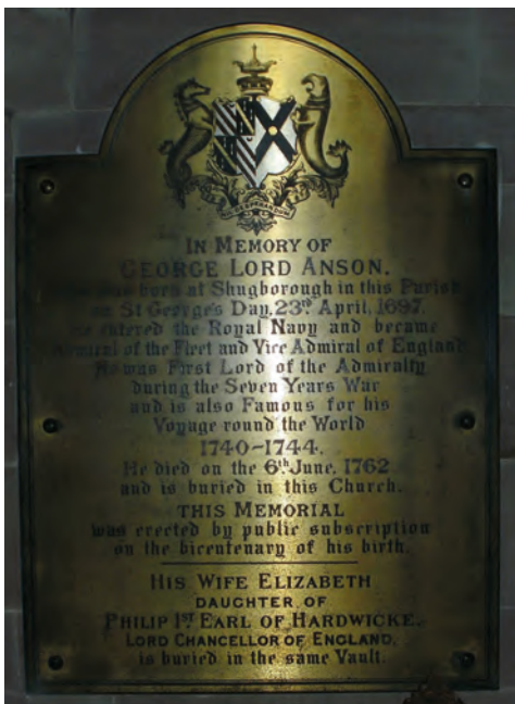
Anson's memorial at St Michael and All Angels' Church in Colwich, Staffordshire, Foto PicturePrince, 2012, CC BY SA 4.0.