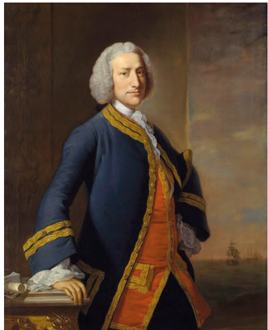
George Hudson, Portrait of George Anson, 1st Baron Anson (1697-1762) National Maritime Museum, BHC2517 Public Domain