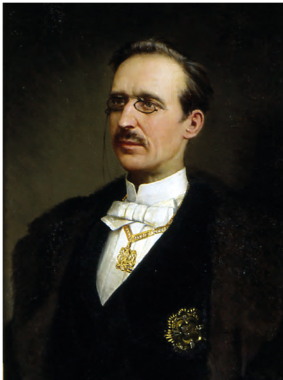
Eliseo Sala (1813–1879). Ritratto di Urbano Rattazzi (1808-1873)

La relazione fu comunque saltuaria, molta la concorrenza delle «créatures venues se faire donner l'obole impériale» 78 .