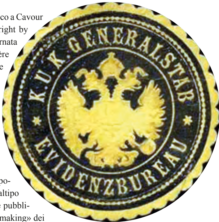
Sigillo del k. u. k. Evidenzbureau.

Sul mythos poco contemporaneo di Garibaldi 245 di idealtipo weberiano di rappresentazione pubblica 246 , ai suoi inizi una «image making» dei