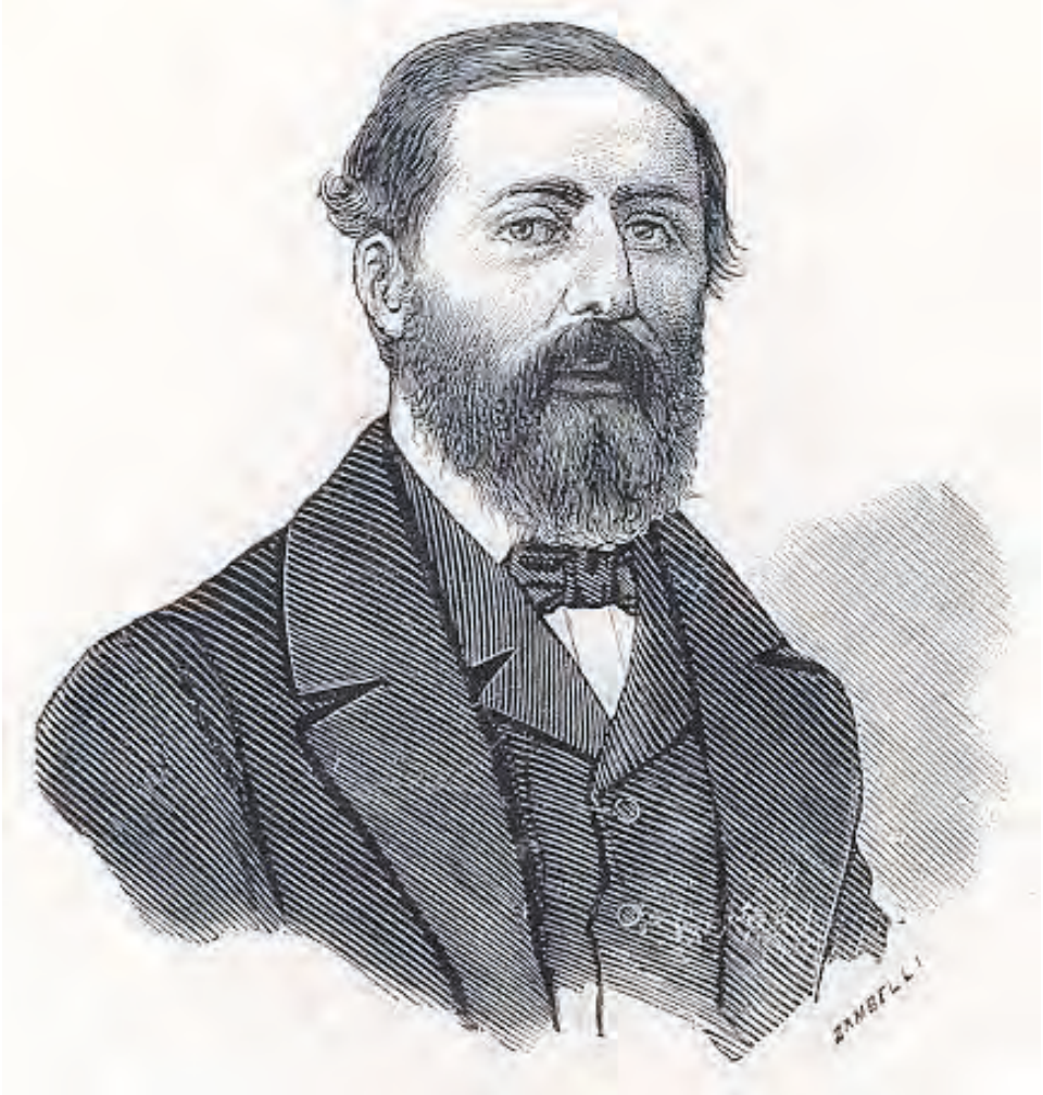
Giuseppe La Farina (1815-1863).