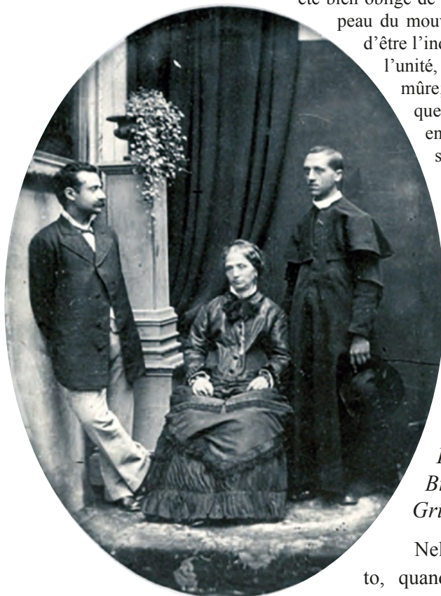
Edgardo Mortara (a destra)