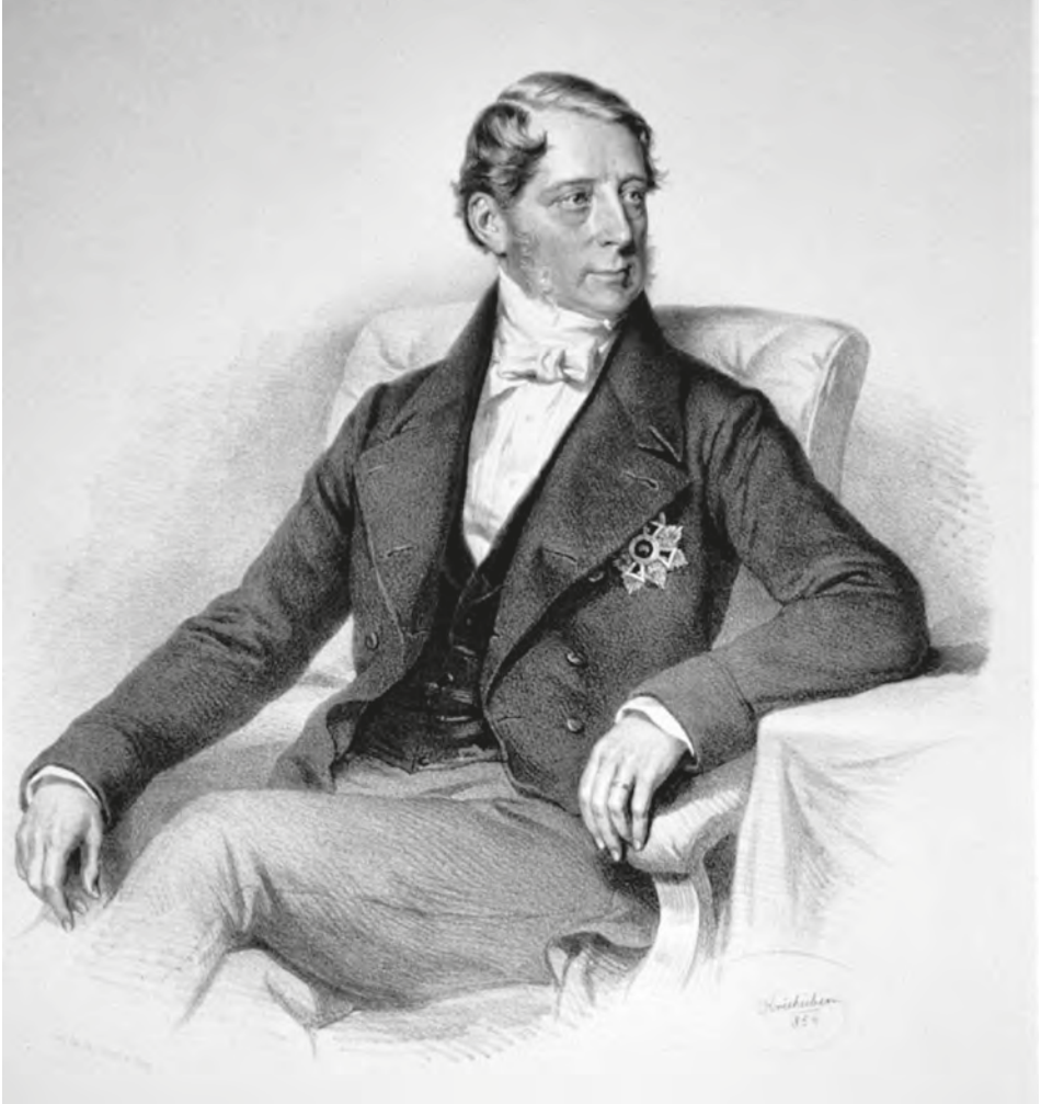
Karl Ferdinand von Buol-Schauenstein (1797-1865), litografia (1854) di Josef Kriehuber (1800-1876).

regista occulto dei “Comitati spontanei” che da Nord a Sud inneggiavano all’annessione.