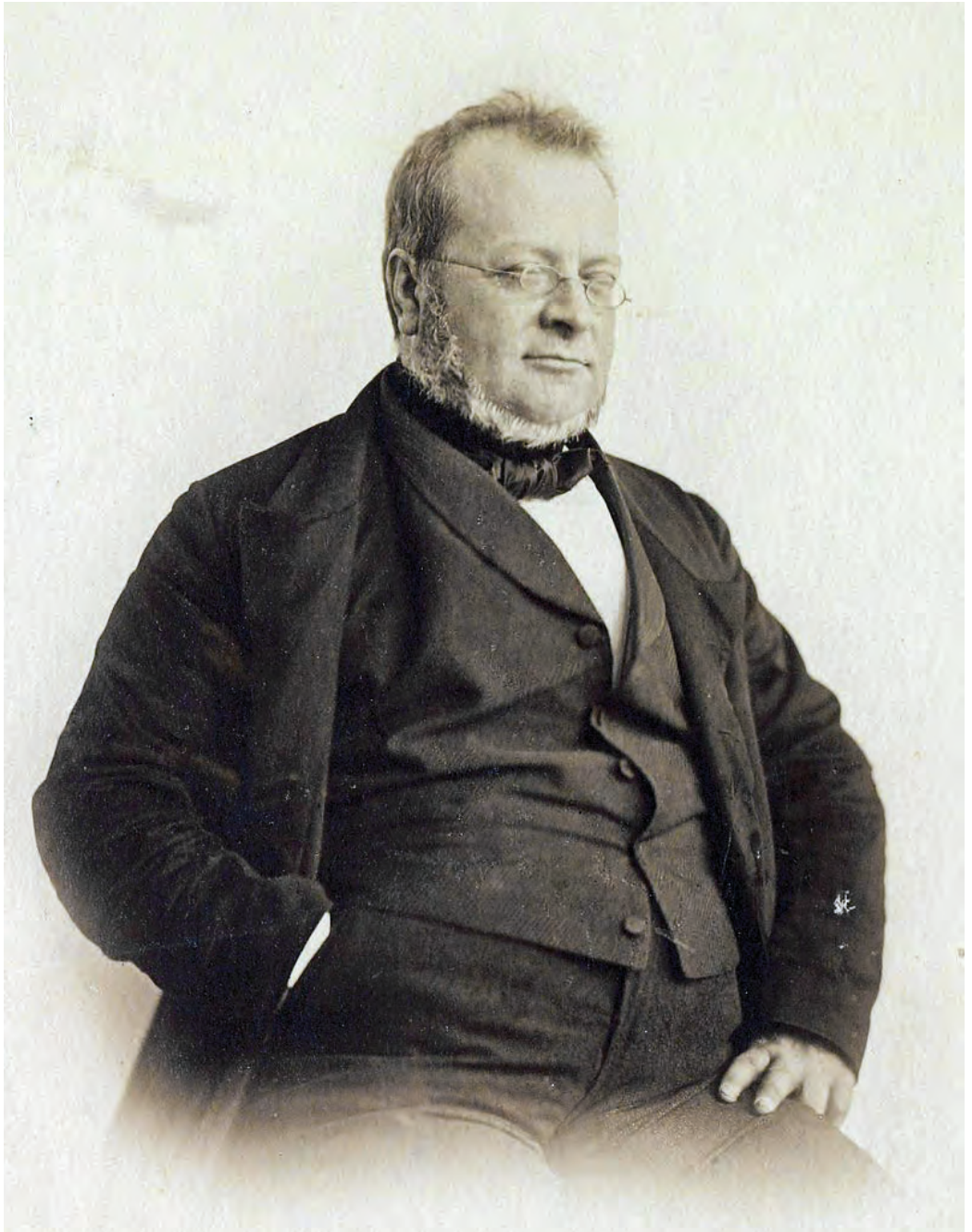
Camillo Benso, conte di Cavour, 1860. Accademia delle Scienze di Torino. Ritratti 0133 B.