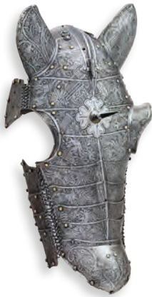
Testiera (Shaffron) per cavallo, Brescia (?) 1560-70 Metropolitan Museum of Arts, New York. Public Domain