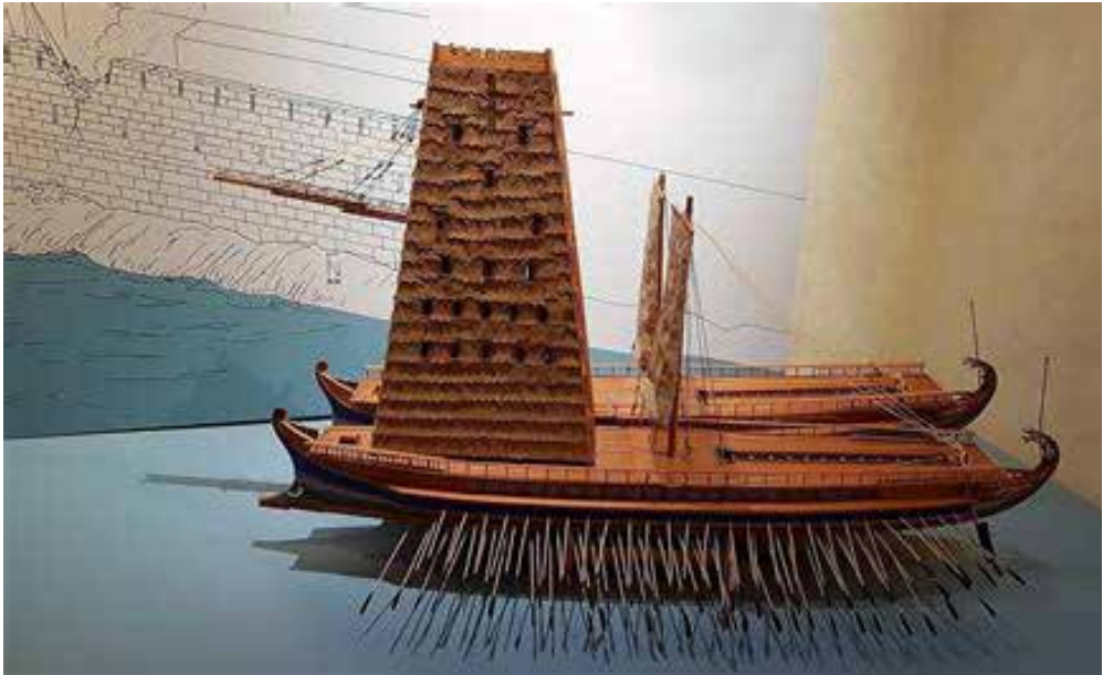
Ricostruzione di una Helépolis , trasportata da due quinqueremi. CC BY-SA 4.0 .

tica sfavorevole agli Antigonidi. Il peplo in cui sarebbero state ricamate le immagini di Antigono e Demetrio potrebbe essere stato quello “annuale” e “minore” volutamente confuso con quello “maggiore” e “penteterico” distrutto invece dall’improvvisa tempesta. Non escludo poi un’azione denigratoria nei confronti dei Soteres ad opera di Filippide o di qualcuno dei suoi collaboratori in sede teatrale: la parodia a lungo andare avrebbe superato e sostituito la verità.