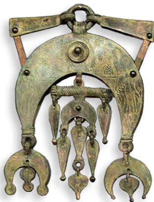
Museo Carnuntinum (Bassa Austria). Pettorale come parte dell'equipaggiamento per cavalli (I secolo) del Reno Settentrionale (?), ritrovamento fluviale.