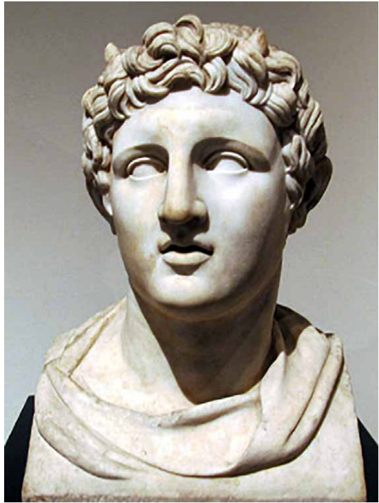
Erma in marmo rappresentante Demetrio Poliorcete. Napoli, Museo Archeologico Nazionale (Inv. No. 6149).

valore di Demetrio, vero e proprio eroe capace di resistere da solo a una moltitudine di nemici e di esporsi impavidamente ai dardi, restando ritto sulla prua della nave (Diod. XX, 52, 1-2). Plutarco ( Demetr. 17-18), pur dando conto dell'umanità mostrata verso i caduti e i prigionieri, tramanda, non senza una nota di biasimo, l'artefatta atmosfera in cui si sarebbe poi svolto l'annuncio della disfatta lagide e l'incoronazione reale che ne sarebbe seguita. Principale artefice di questa messinscena sarebbe stato Aristodemo di Mileto, collaboratore di Antigono, definito dal Cheronese uno dei più grandi adulatori dell' entourage antigonide. Dopo un lungo silenzio che aveva lasciato presagire il peggio, Aristodemo annunciò la vittoria chiamando Antigono re. Questi, notoriamente poco avvezzo a tali manifestazioni, rispose che per il tormento inferto a lui e alla corte radunata ad Antigonea all'Oronte, avrebbe ricevuto in ritardo il salario. Billows 19 ha ravvisato un fondo