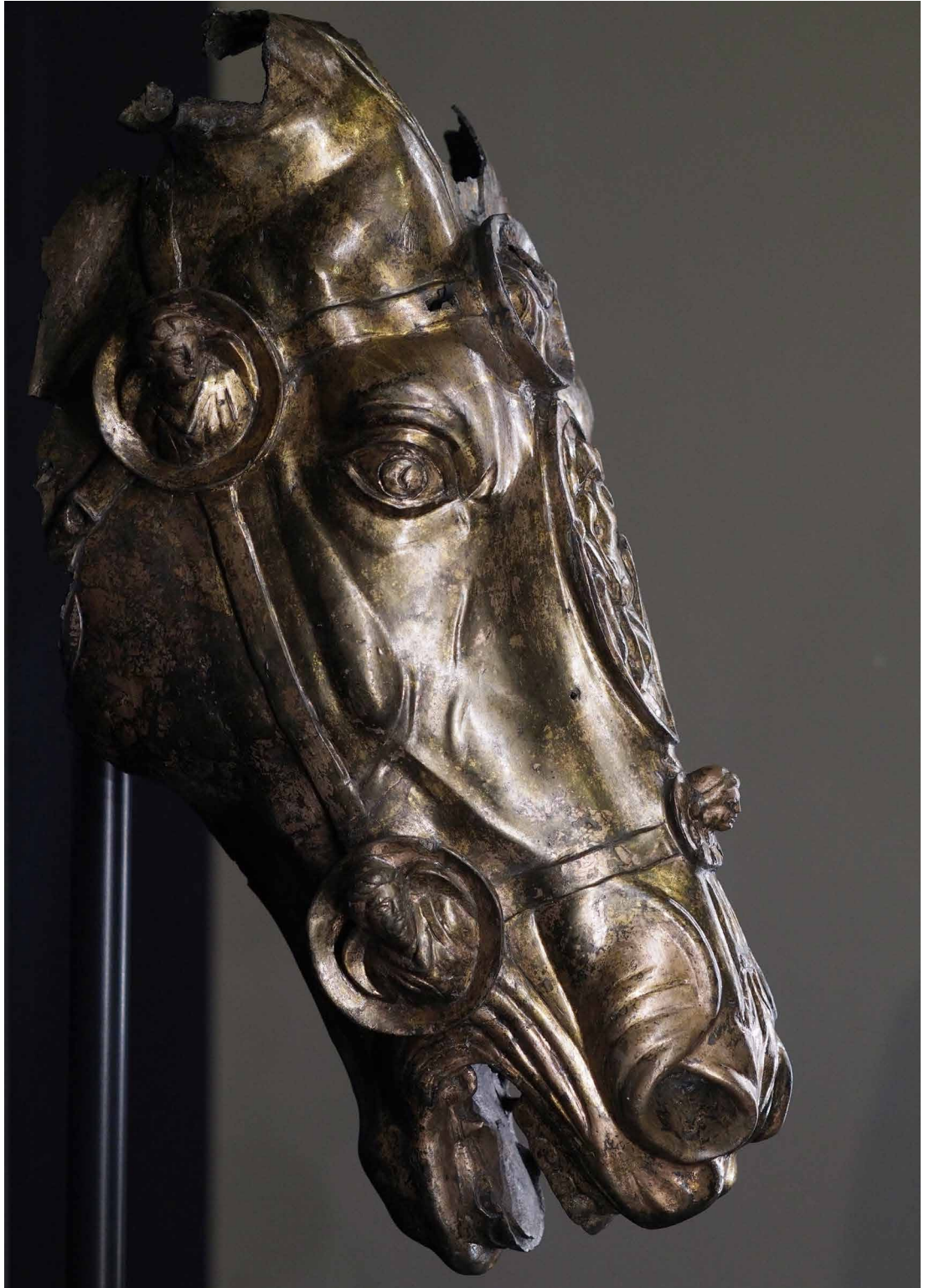
Testa di cavallo di Waldgirmes nel Museo di Saalburg, Bad Homburg. Foto Crossbill, 2018, licenza CC SA-03 unported.