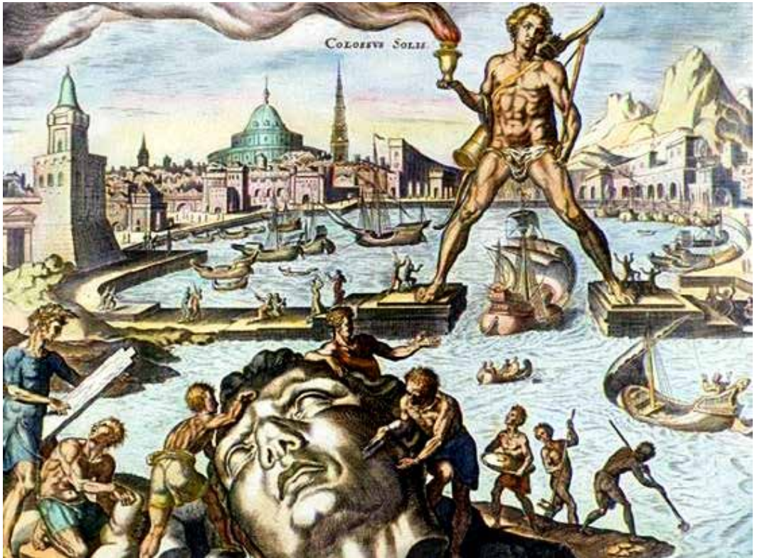
Colosso di Rodi, immaginato in un'incisione del XVI secolo di Martin Heermeskerck, parte della serie delle Sette Meraviglie del Mondo. Per celebrare la loro vittoria su Demetrio Poliorcete, i Rodiesi decisero di costruire una gigantesca statua in onore di Elio, il loro dio protettore.

Il testo che esalta, come già avviene in ISE 5 , i successi terra marique passati e presenti del Poliorcete, si presenta come un'abile operazione pubblicitica redatta secondo i canoni della rappresentazione del potere antigonide nella temperie del primo Ellenismo. Demetrio è il paladino della democrazia, fautore della libertà individuale delle città, le quali a loro volta riconoscono in lui un solerte protettore al punto da auspicare un'annessione al suo regno. Si anticipano i topoi pubblicitici che saranno canonizzati nel seriore inno itifallico: centrale è la caratterizzazione di Demetrio come figura presente e, ancor di più, capace di sob-