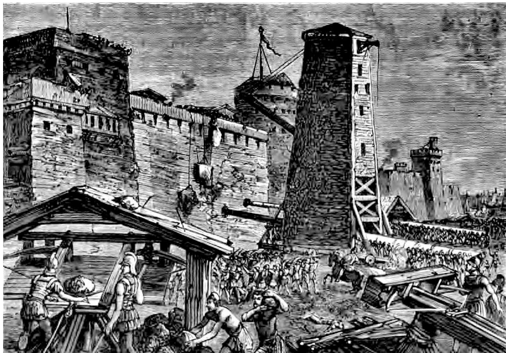
Riproduzione dell'assedio di Rodi dalla Cassell's Illustrated Universal History di Edmund Oiler (1882).

I Délos 1403 riporta un inventario di beni custoditi all'interno del neórion . Alla l. 40 Tréheux 32 ha visto nella ricostruita presenza della parola σ[τεφάνην] un riferimento alla regalità: la disposizione di una corona come elemento decorativo di una delle due prue dorate presenti nel prodomos del neorion verrebbe a certificare l'origine regale del monumento e la sua consacrazione da parte di uno dei Diadochi. Secondo lo studioso francese, la figura del Gonata mal si attaglierebbe quale dedicante del monumento considerando quanto riportato in IG XI, 2, 219 A (ll. 42-43): al 272/1 a.C., data di questa seconda iscrizione, il neorion risulta già compiuto e, per di più, oggetto di un intervento di manutenzione annuale. Questo dettaglio ha così vanificato l'ipotesi del Vallois 33 , ripresa da Roux 34 , per cui sa-