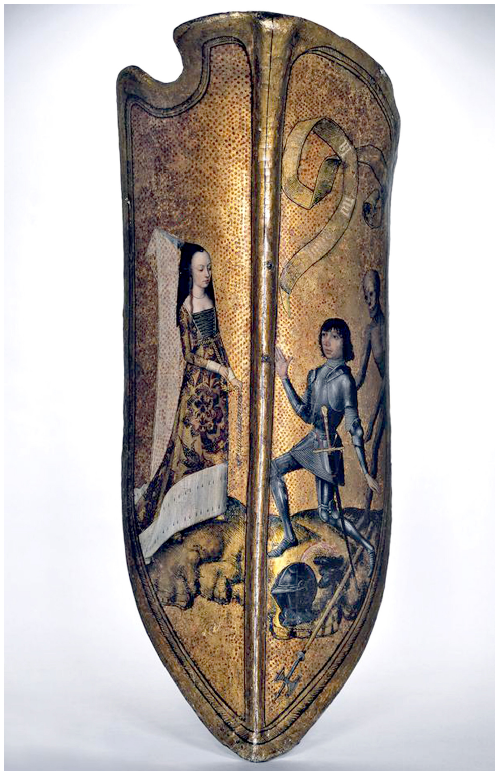
Targa in legno, ricoperta di gesso dipinto con tema cortese, Francia o Belgio, 1470 circa, Londra, British Museum, inv. 1863.0501.1