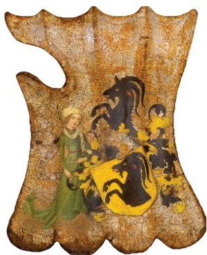
Targa in legno, ricoperta di gesso dipinto con tema cortese, Francia o Belgio, 1470 circa, Londra, British Museum, inv. 1863.0501.1